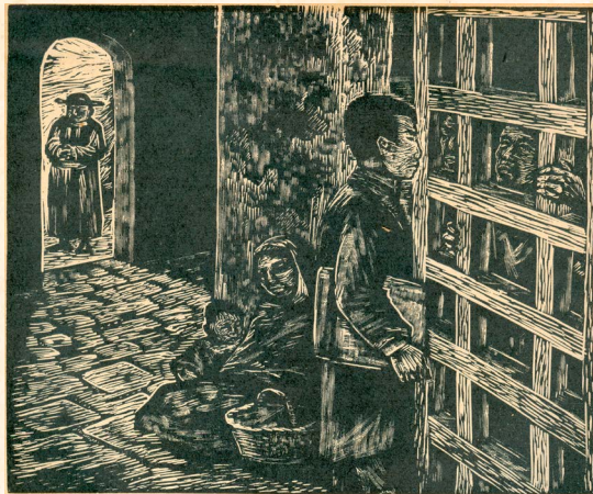
El abogado de los pobres , grabado de Fanny Rabel.

Cursó estudios en el Seminario de Santa Cruz y en el Instituto de Ciencias y Artes, en donde, aún siendo estudiante, en reconocimiento a su talento y aplicación, fue encargado de la cátedra de física ( Documento 2 ), convirtiéndose poco después en el primero en graduarse como abogado por esa institución. Gracias a su formación, a su firme voluntad y gran capacidad de trabajo, inició su carrera política como regidor del Ayuntamiento ( Documento 3 ), enfrentando después otras responsabilidades como diputado local y federal, juez de primera instancia, magistrado del Supremo Tribunal, hasta llegar a la gubernatura de Oaxaca.