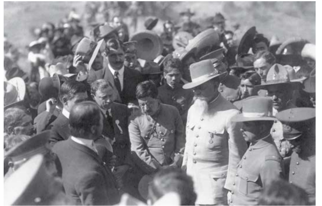
Foto. Autoridades de Querétaro recibiendo a Venustiano Carranza. 1916.