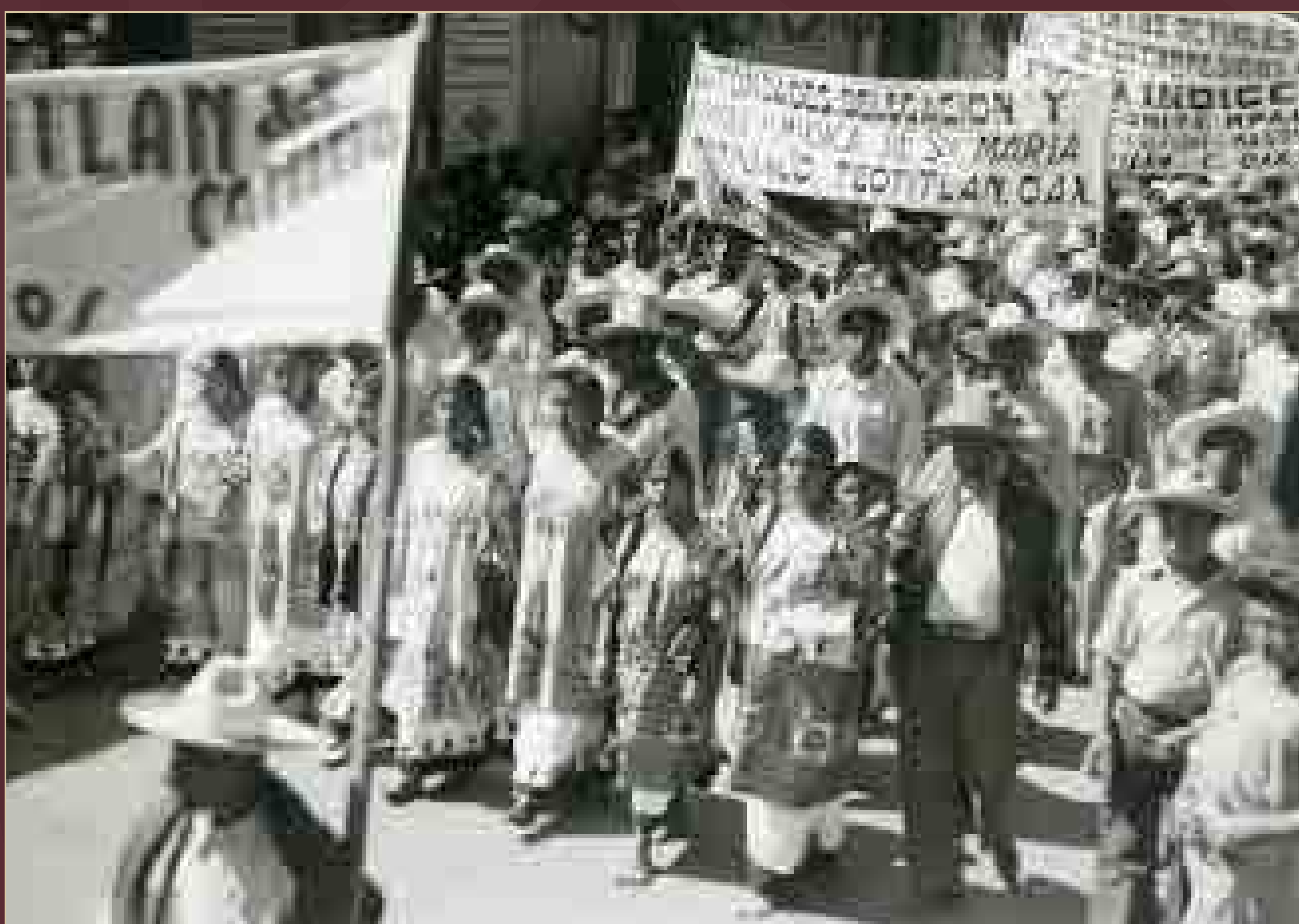
Marcha de campesinos de Teotitlán, Oaxaca, ca. 1935.