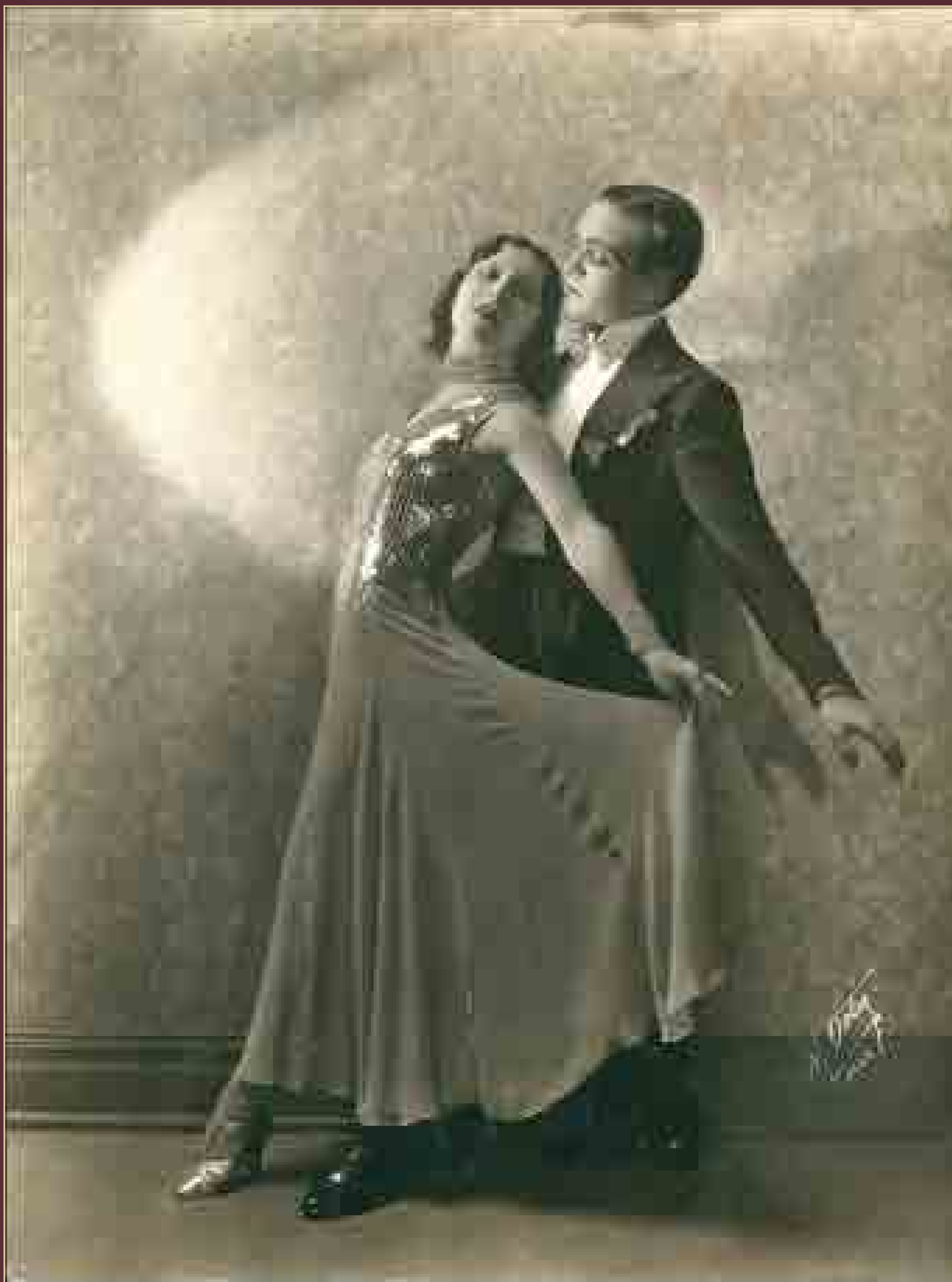
Pareja de bailarines, México, ca. 1927.