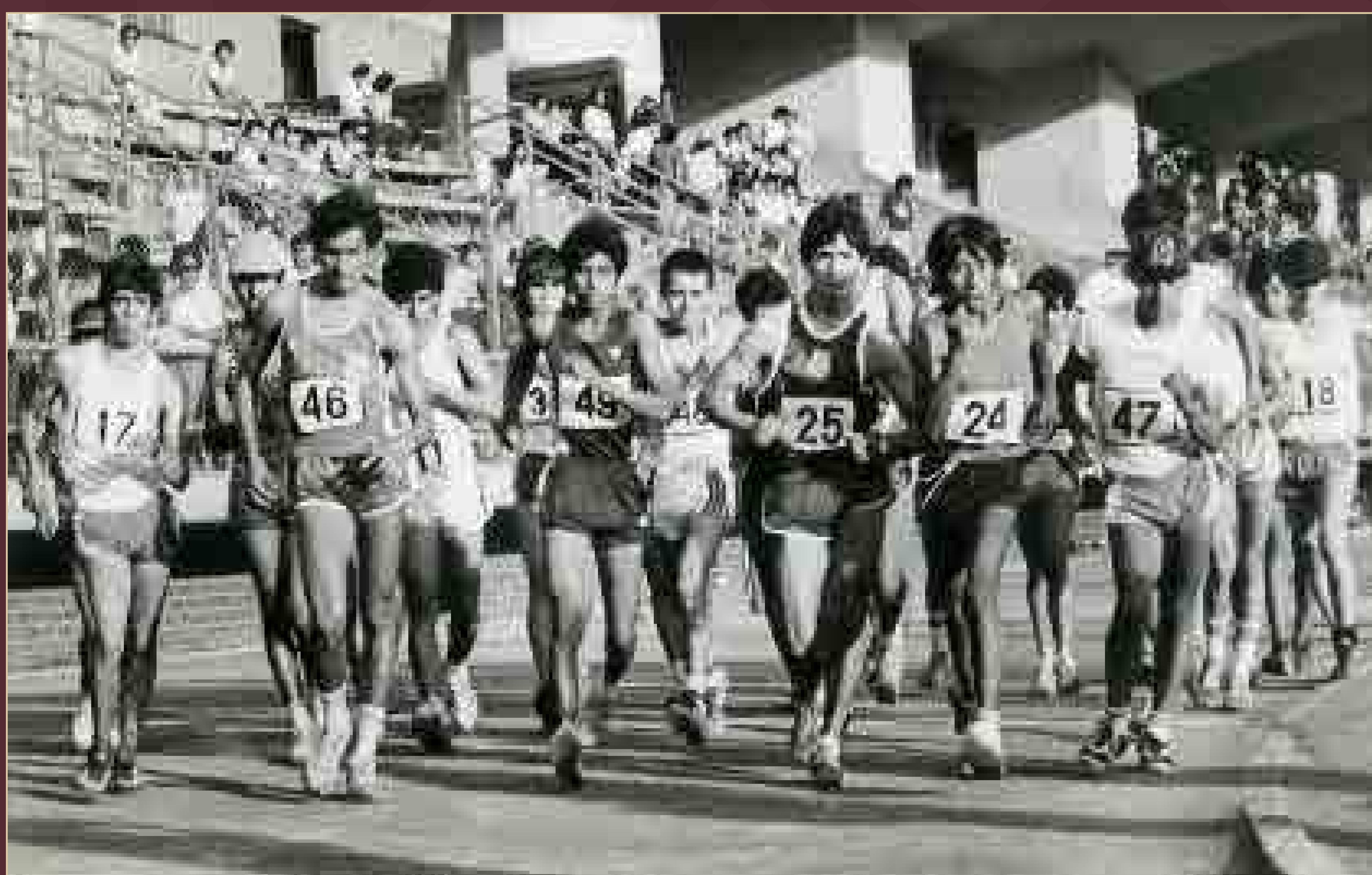
Primera vuelta a la pista en la VIII Semana Internacional de Caminata, México, 10 de abril de 1984.

Archivo Gráfico de El Nacional . Fondo Deportes. Sobre: Atletismo-A (006).