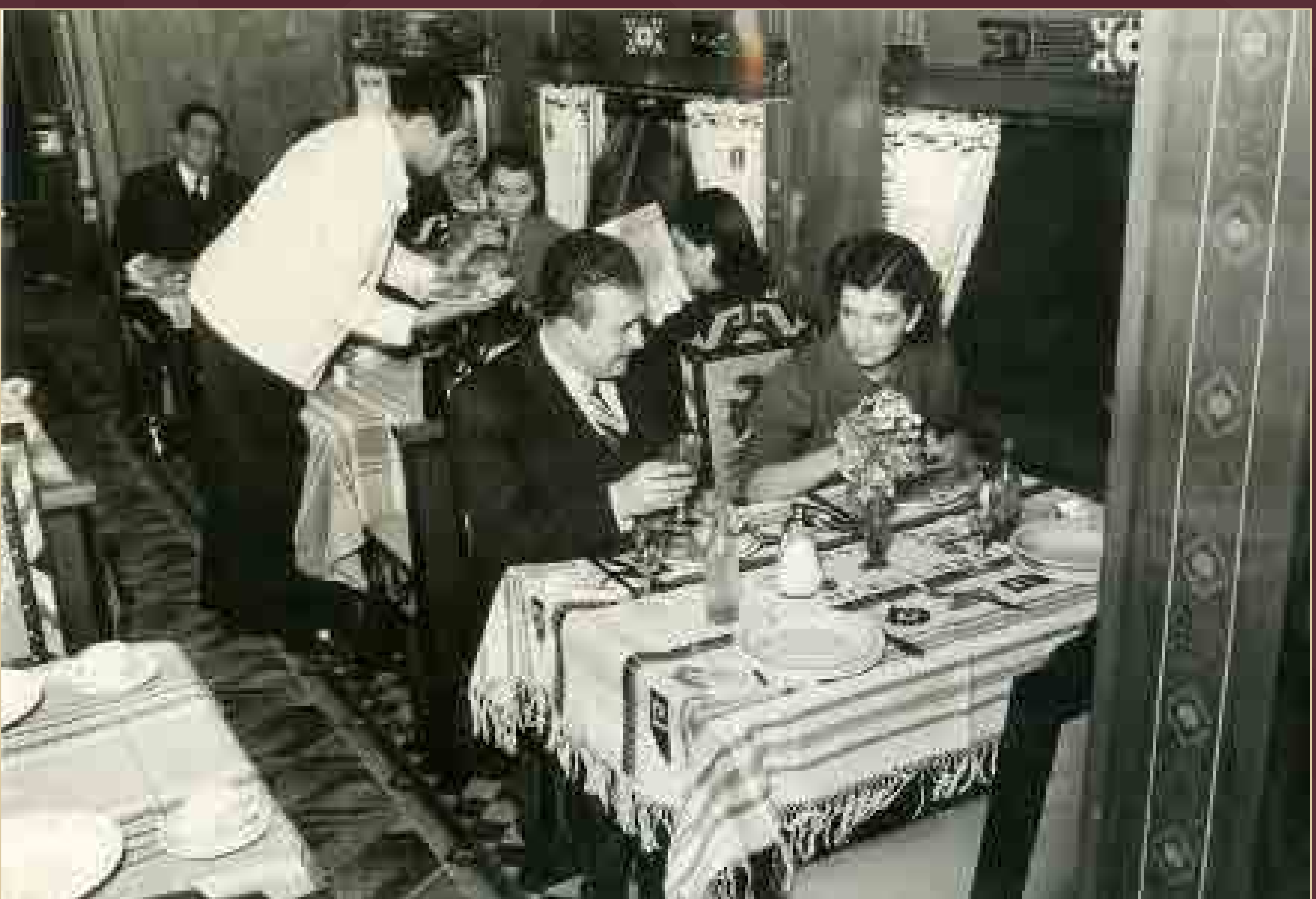
Carro-comedor de los Ferrocarriles Nacionales, México, ca. 1950.