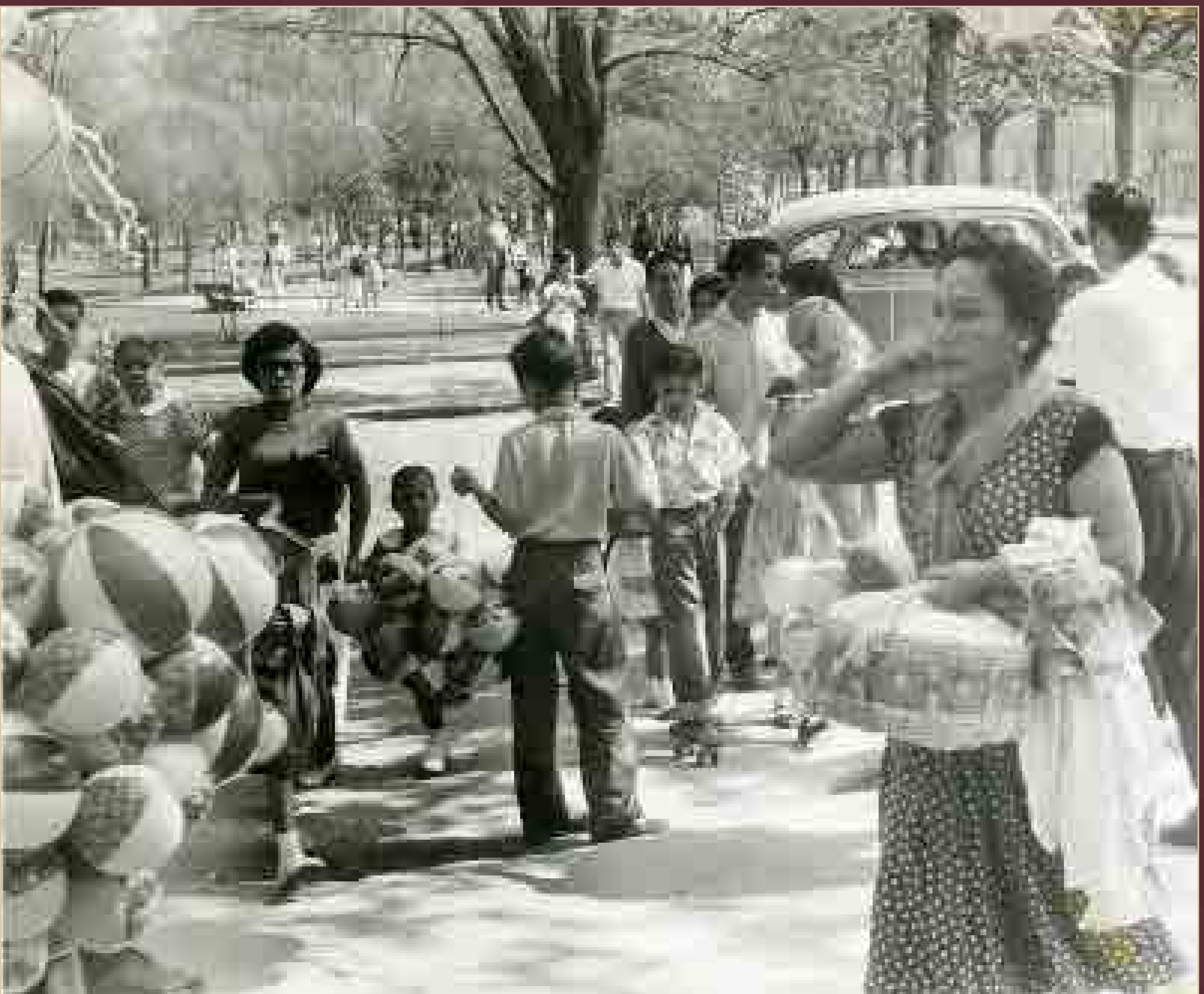
Tarde dominical en el Bosque de Chapultepec, ciudad de México, ca. 1960.

Archivo Gráfico de El Nacional . Fondo Temático. Sobre: 475 (013). SECRETARÍA DE CULTURA.INEHRM.FOTOTECA.