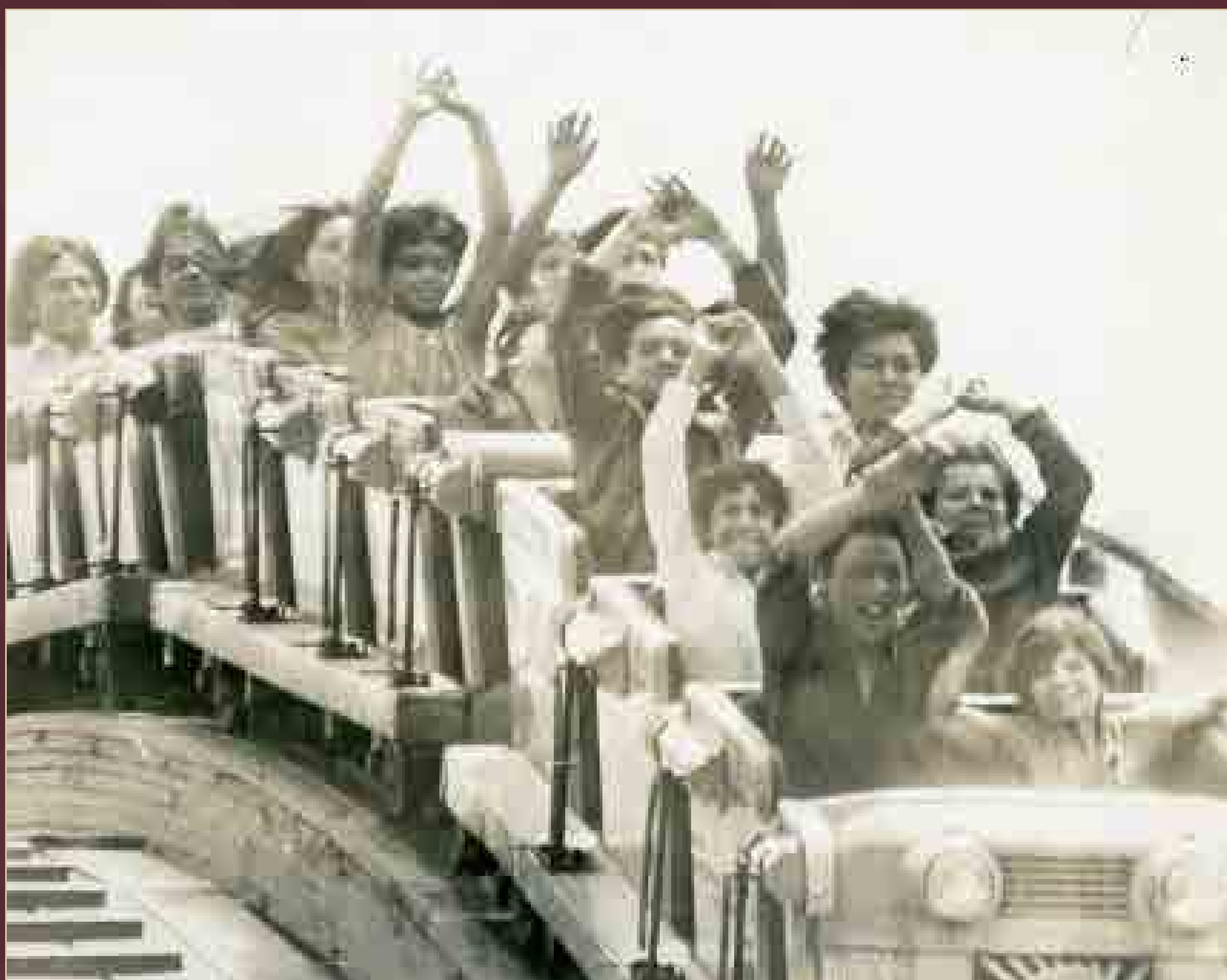
La Montaña Rusa de Chapultepec, ciudad de México, ca. 1970.