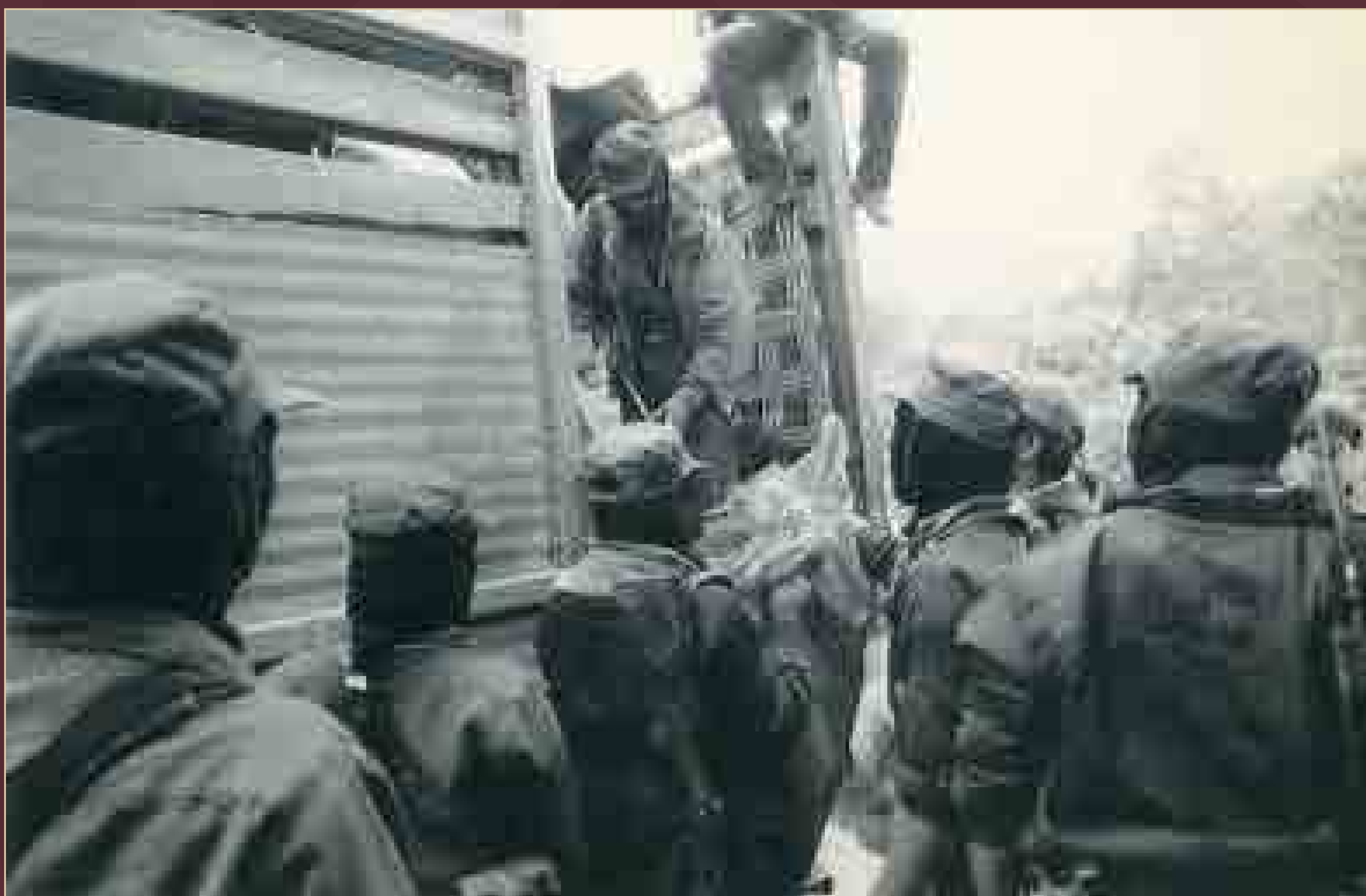
Descarga de víveres, ropa y juguetes procedentes de México para la zona en conflicto, Veracruz municipio de Las Margaritas, Chiapas, 29 de diciembre de 1994.

Archivo Gráfico de El Nacional . Fondo Temático. Sobre: 1007-C (007).