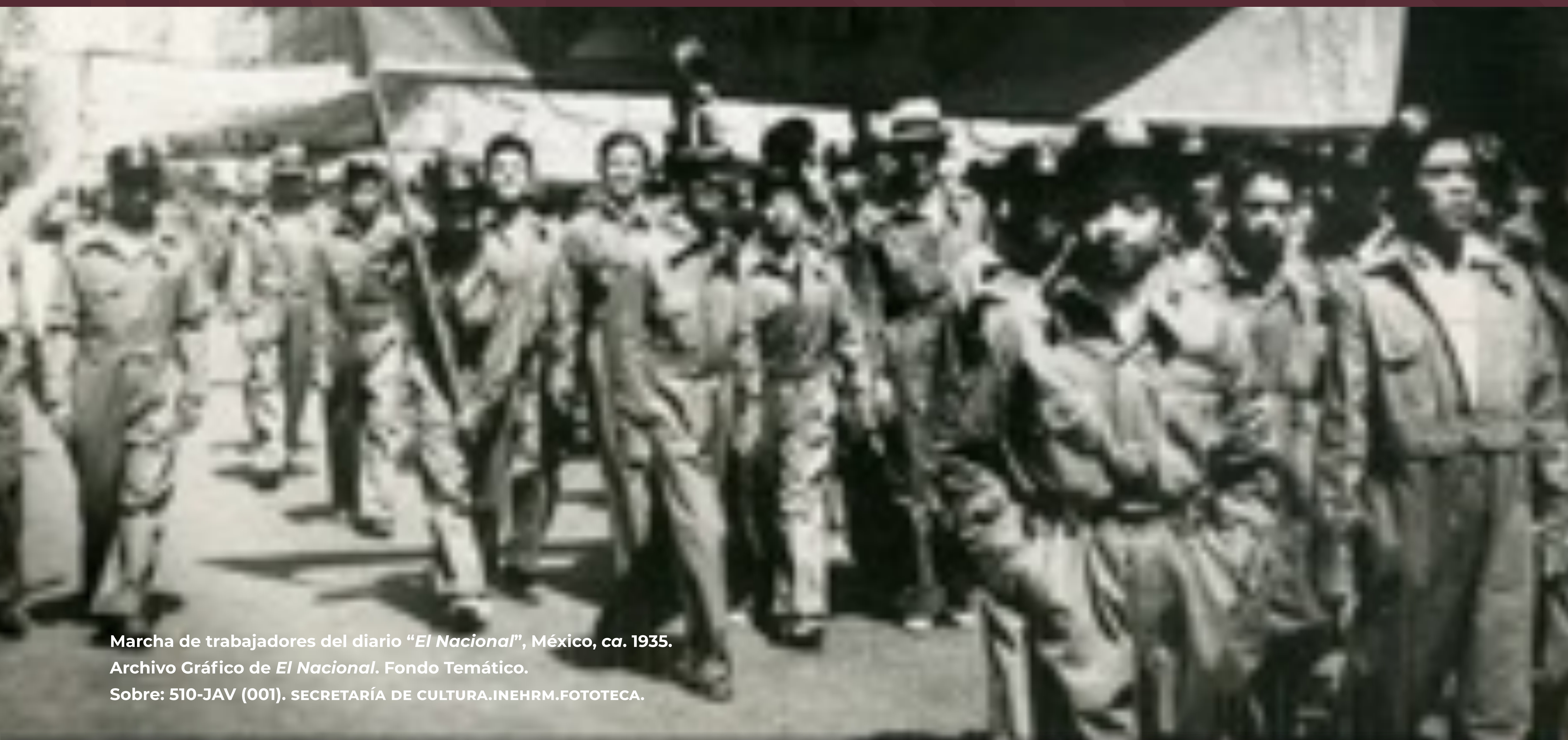
Marcha de trabajadores del diario "El Nacional", México, ca. 1935. Archivo Gráfico de El Nacional . Fondo Temático. Sobre: 510-JAV (001). SECRETARÍA DE CULTURA. INEHRM.FOTOTECA.

Este esfuerzo colaborativo entre las áreas de investigación y editorial y el Acervo Fotográfico del INEHRM, tiene como objetivo visibilizar y difundir la memoria gráfica del país, impulsando futuras investigaciones y ofreciendo un recurso invaluable para quienes deseen viajar visualmente y explorar el pasado, que aún resuena en nuestro imaginario contemporáneo.