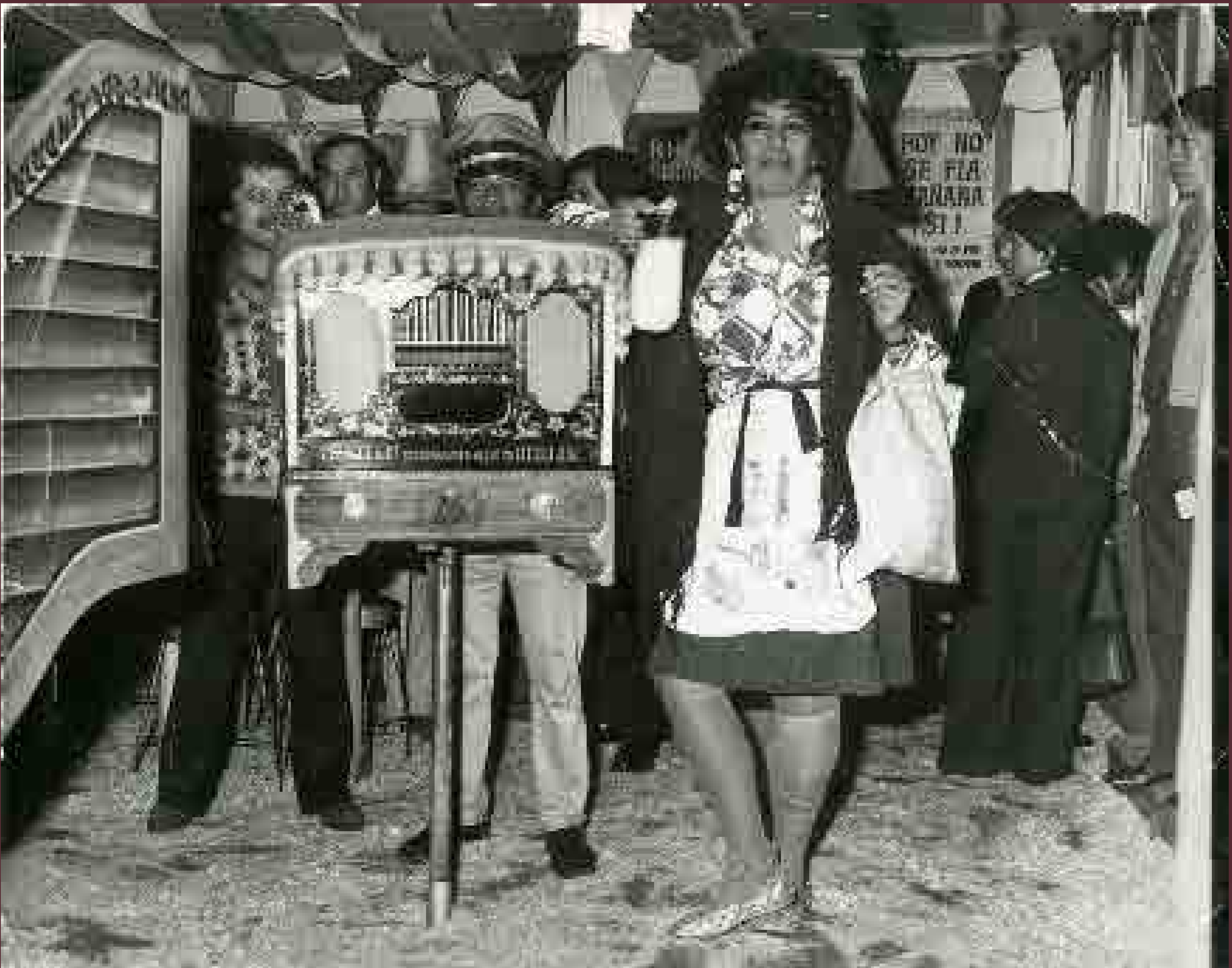
Cilindrero en una pulquería de la ciudad de México, ca. 1965.