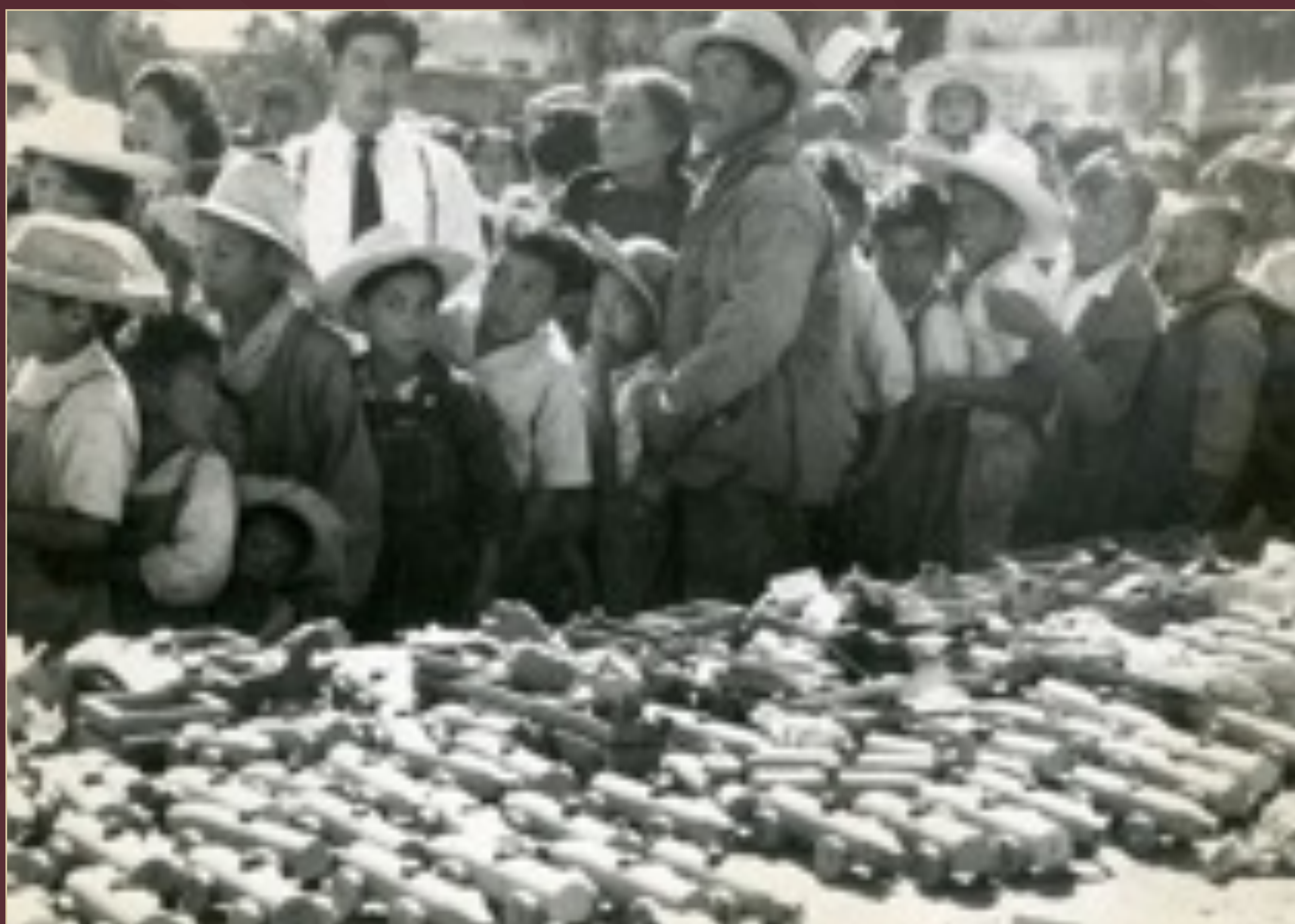
Cambio de botellas de alcohol por juguetes. Campaña antialcohólica, México, ca. 1937.

Archivo Gráfico de El Nacional . Fondo Temático. Sobre: 0012-B (007). SECRETARÍA DE CULTURA.INEHRM.FOTOTECA.