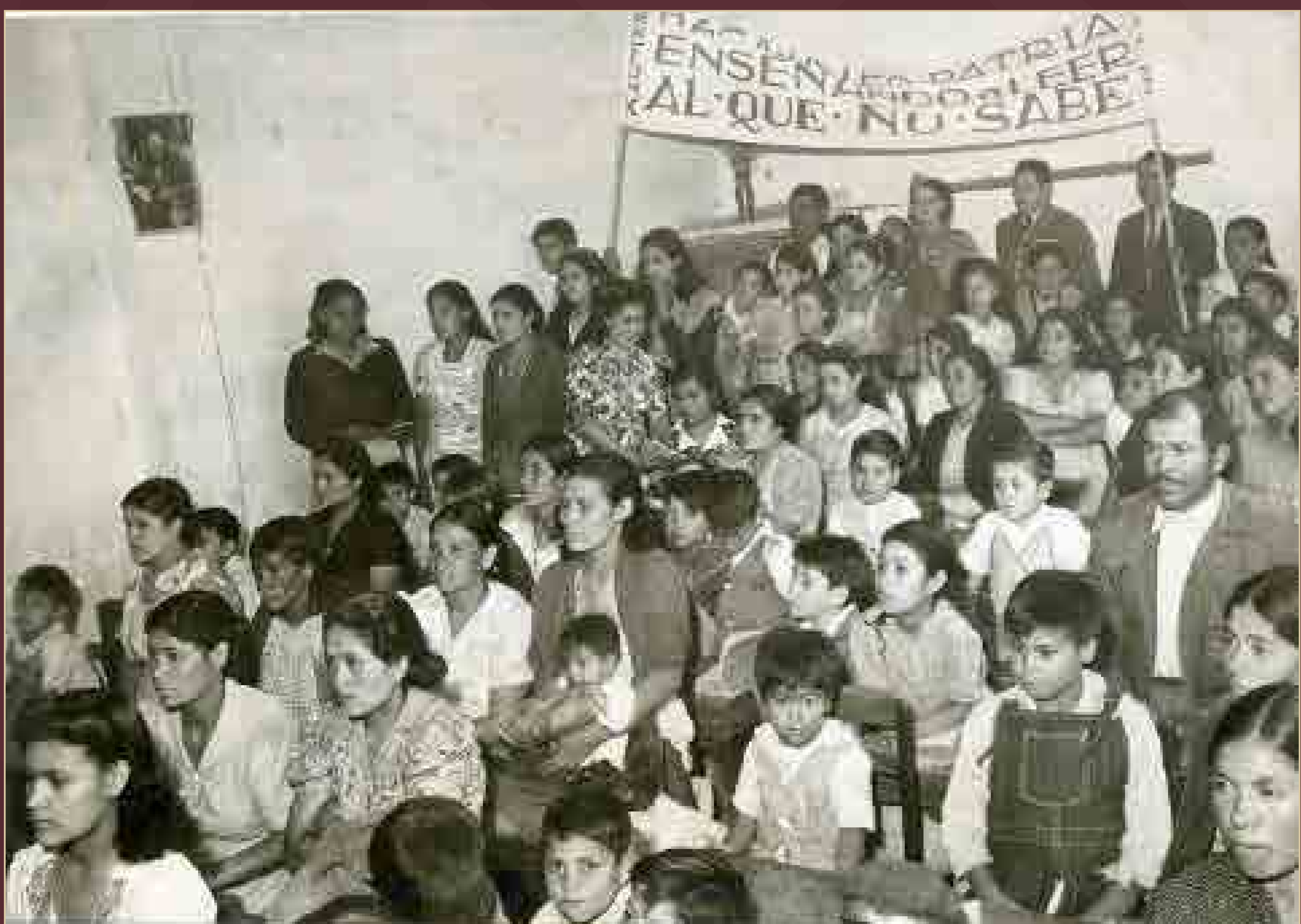
Campaña de alfabetización, México, ca. 1940.

Archivo Gráfico de El Nacional . Fondo Temático. Sobre: 0294-A (014). SECRETARÍA DE CULTURA.INEHRM.FOTOTECA.