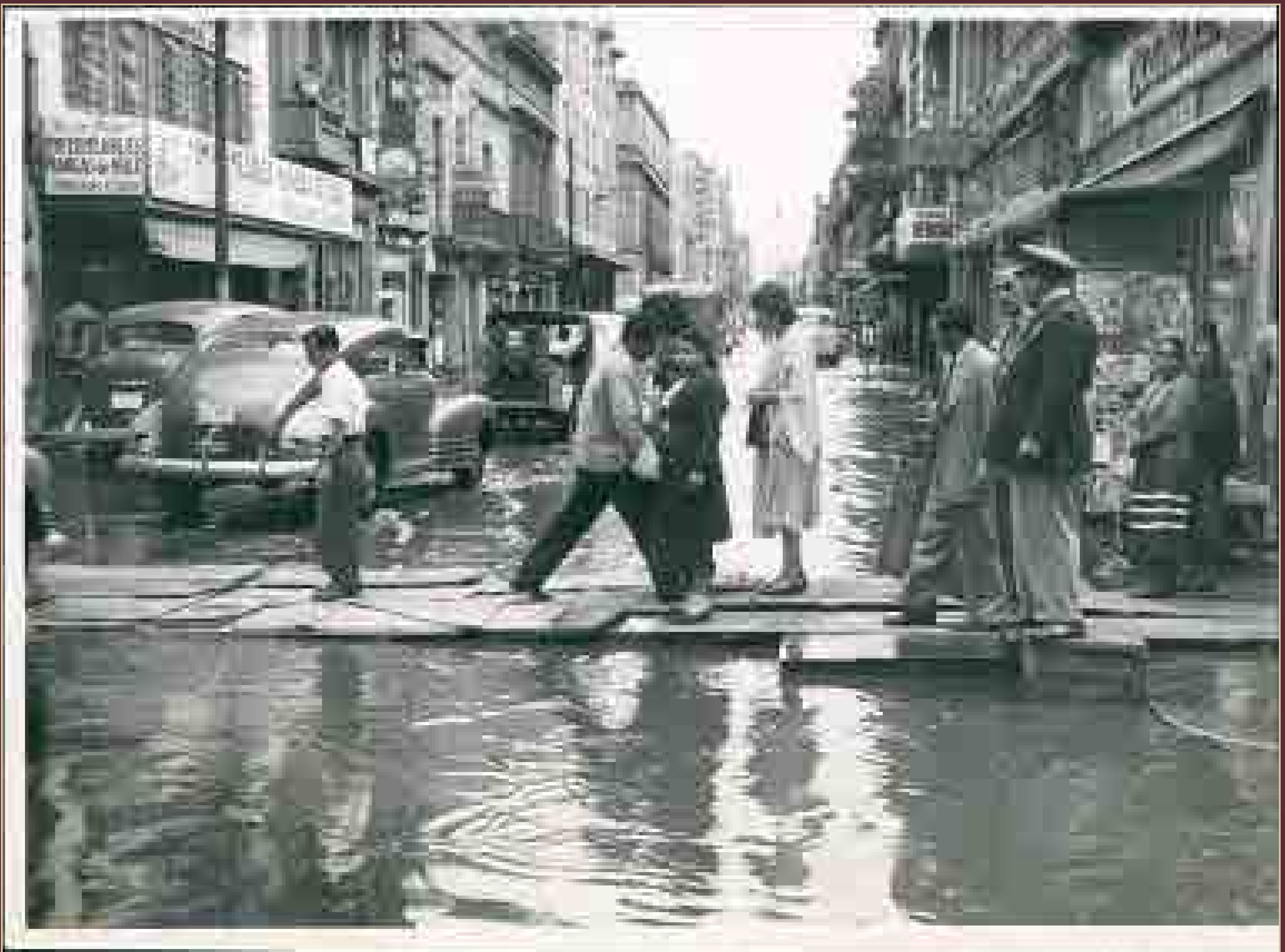
Inundaciones en el Centro de la Ciudad de México, 12 de julio de 1951.