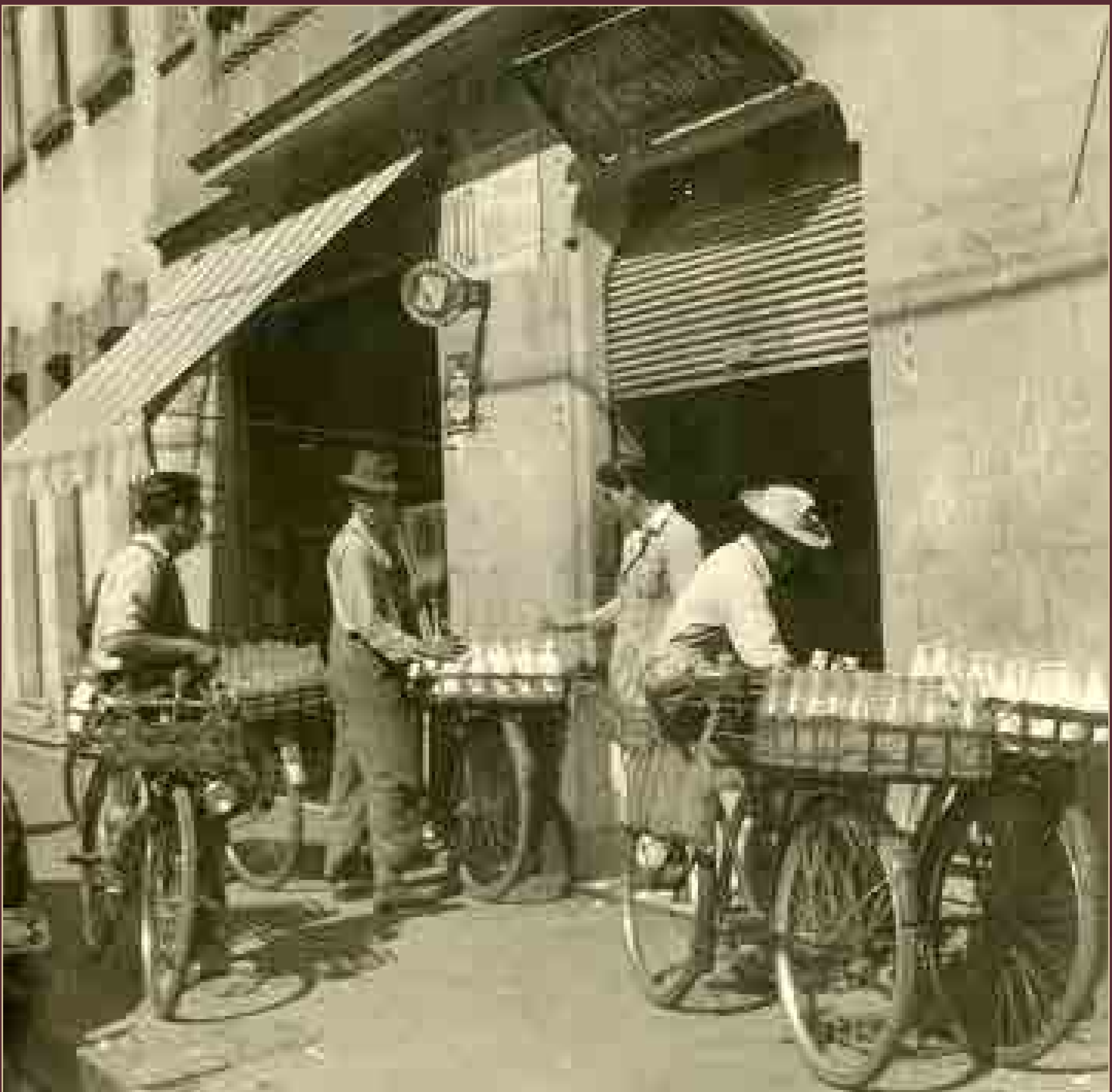
Entregando la leche, México, ca. 1940.