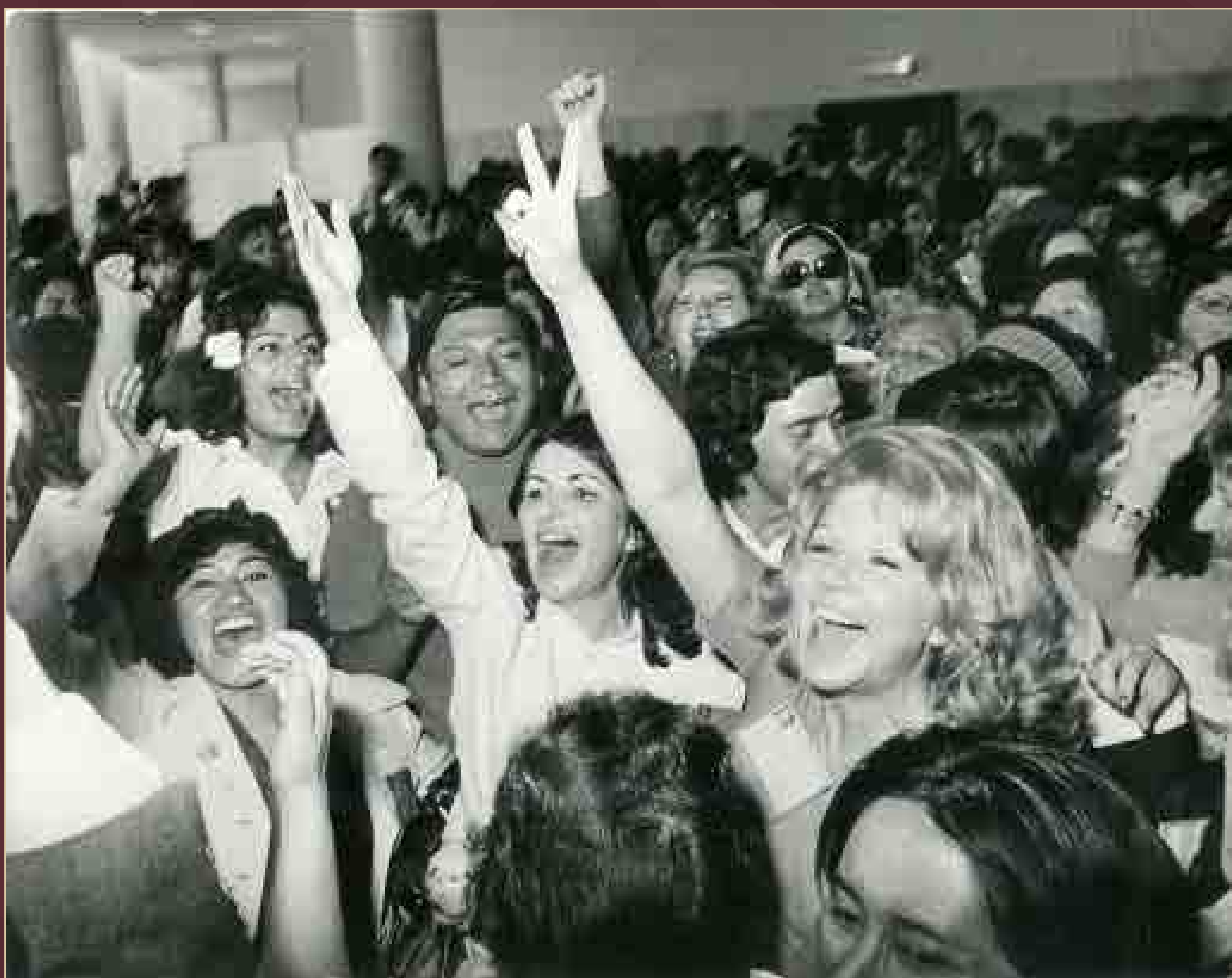
Último día del Año Internacional de la Mujer, Centro Médico Nacional, ciudad de México, julio de 1975.