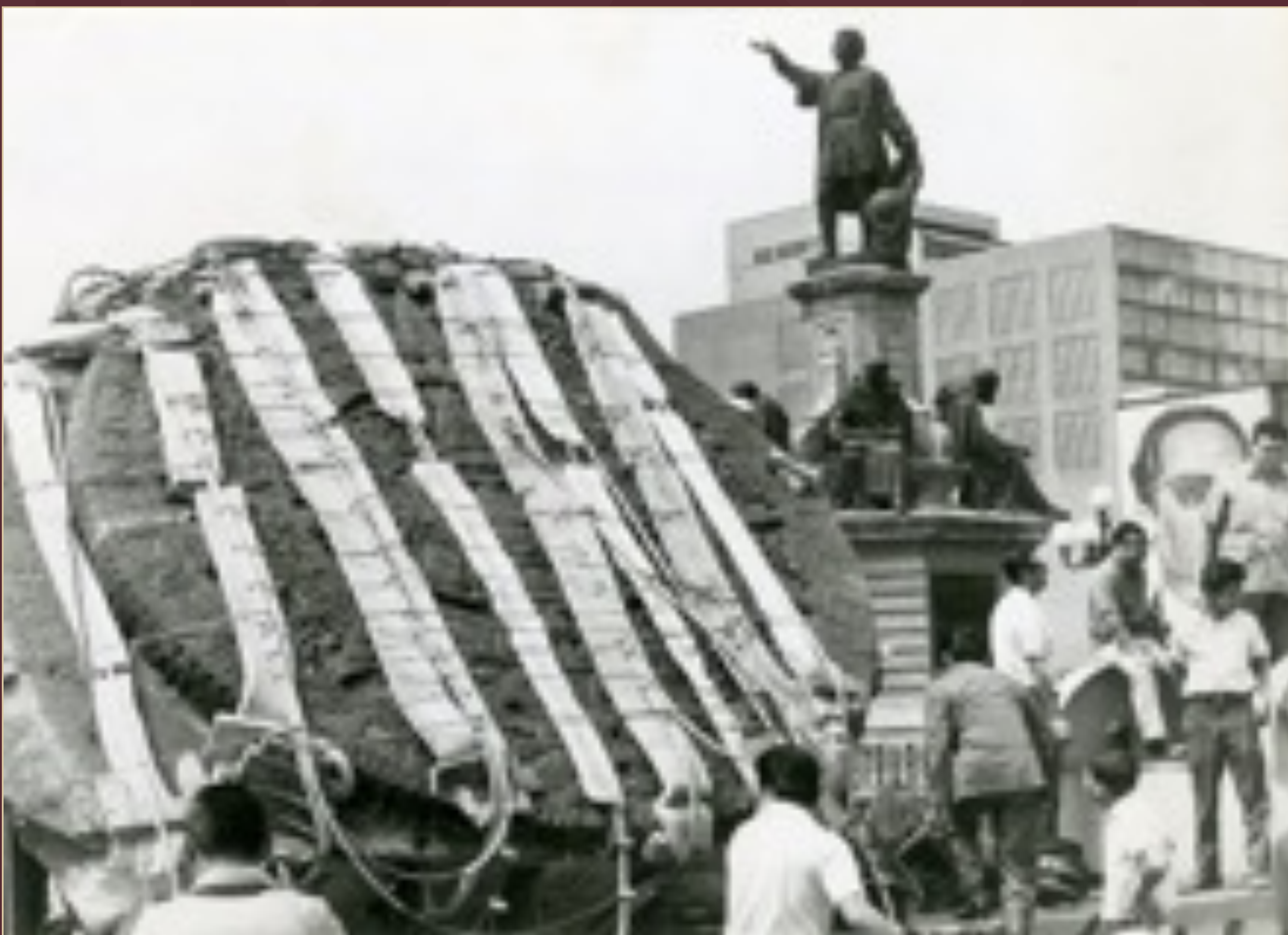
Traslado del Calendario Azteca por Paseo de la Reforma a su nueva ubicación en el Museo de Antropología en el Bosque de Chapultepec, 27 de junio de 1964.