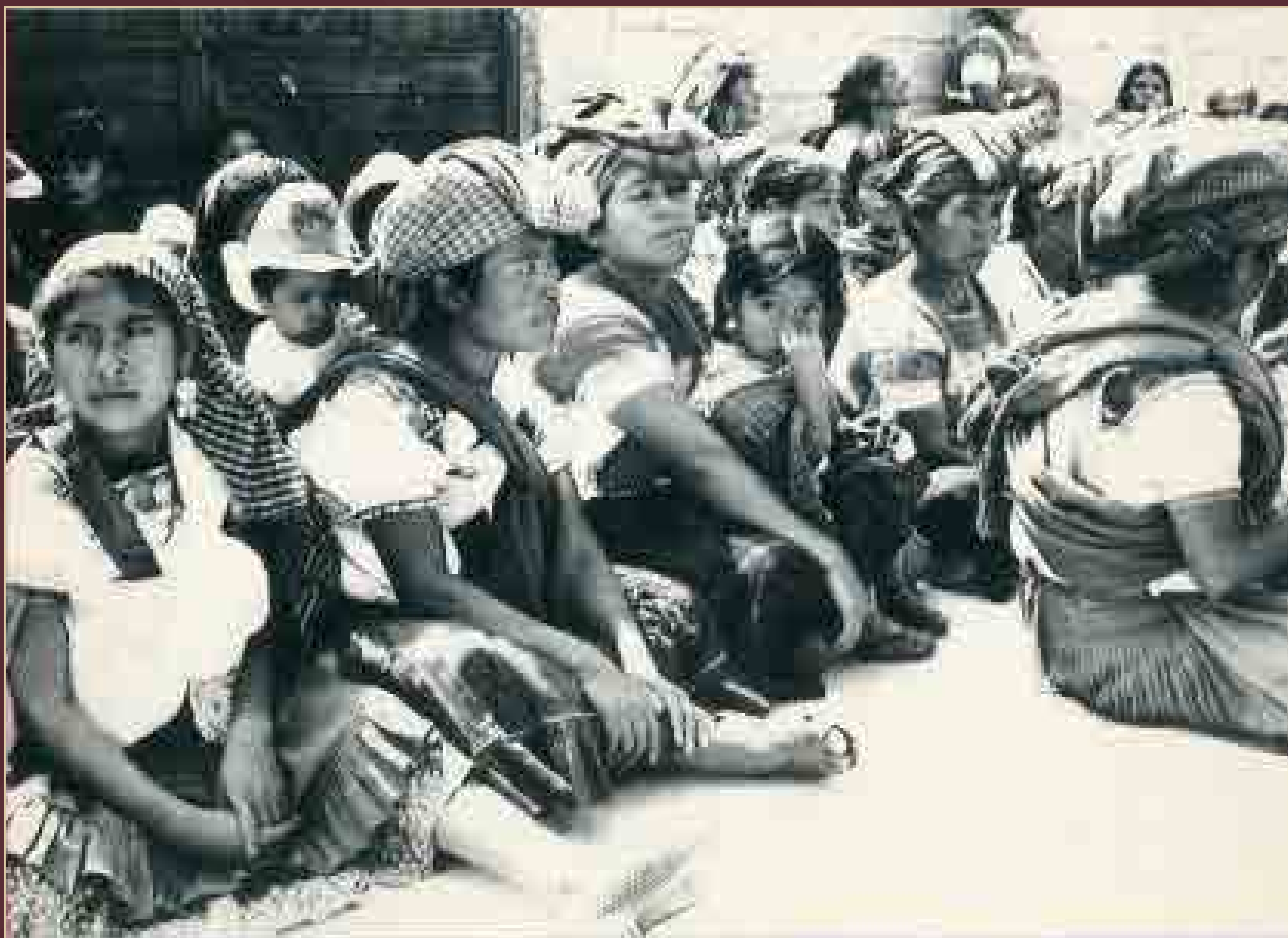
Mujeres en los Altos, Nichinantic, Chiapas, 1994.