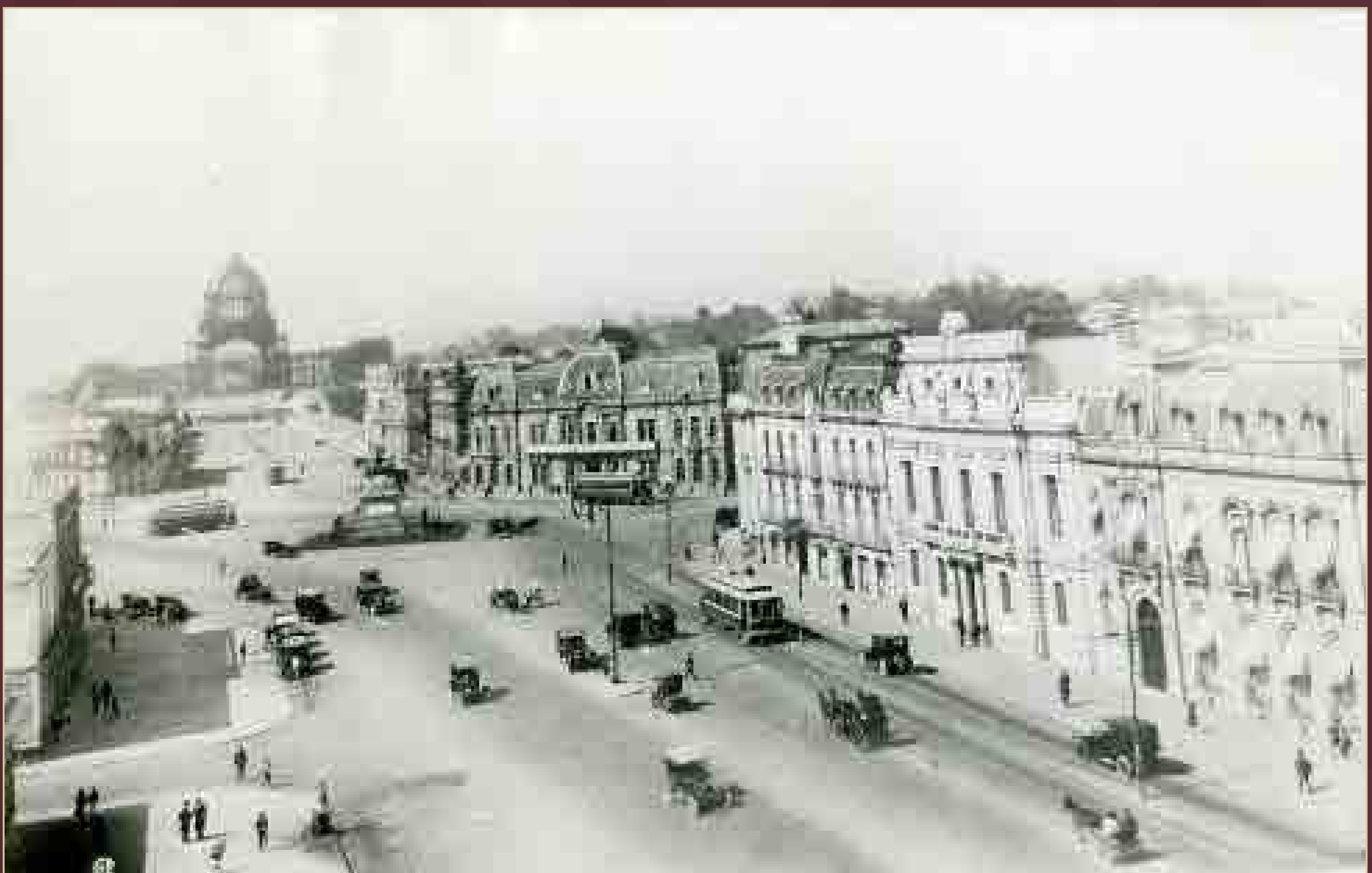
Paseo de la Reforma, aún con la Glorieta del Caballito y la estructura del Palacio Legislativo, México, ca. 1925.