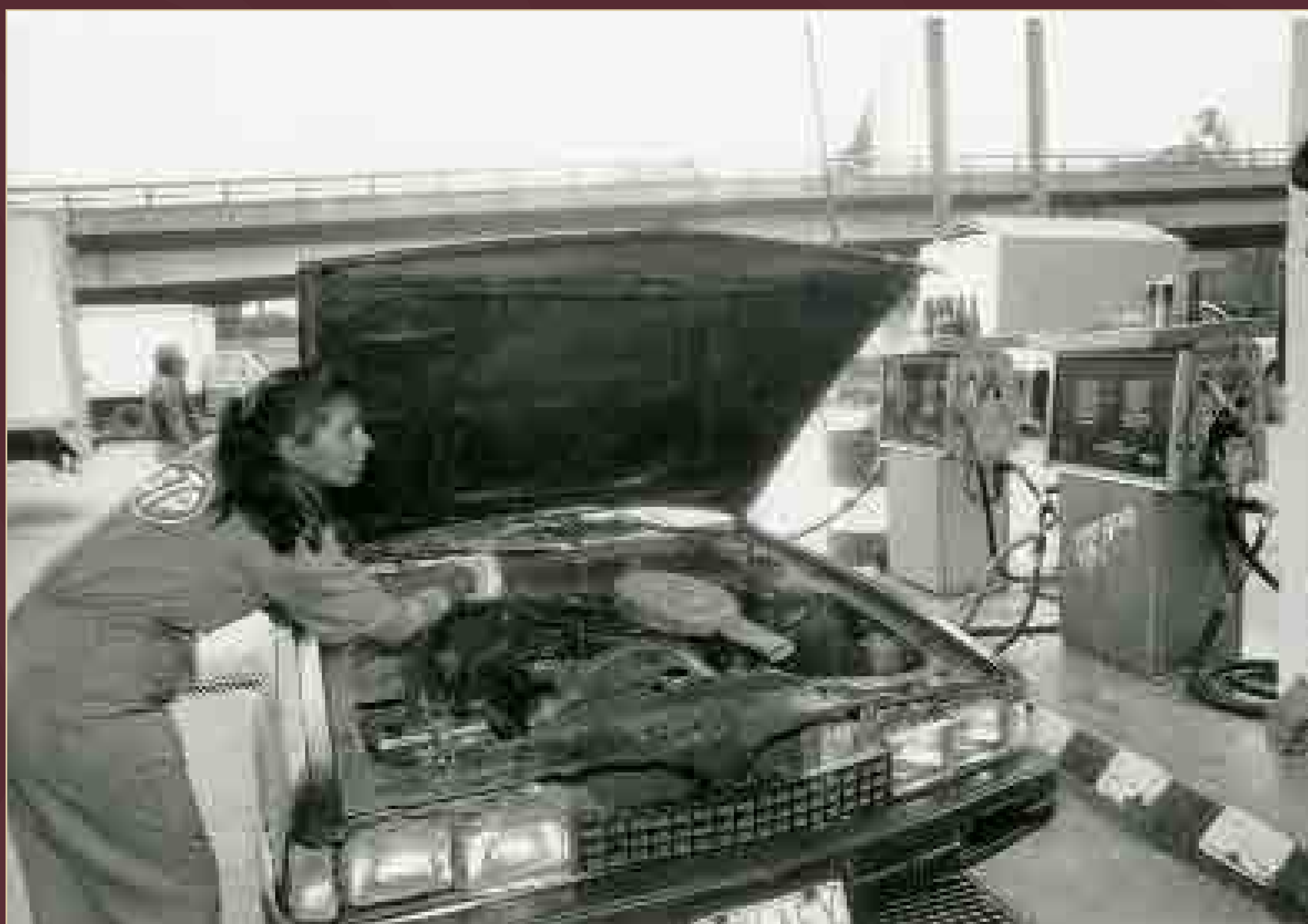
Mujer mecánica, México, ca. 1986.