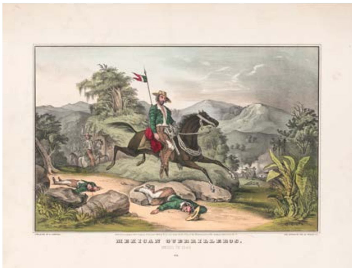
"Mexican guerrillero. Mexico in 1848", N. Currier lithograph, New York, 1848.