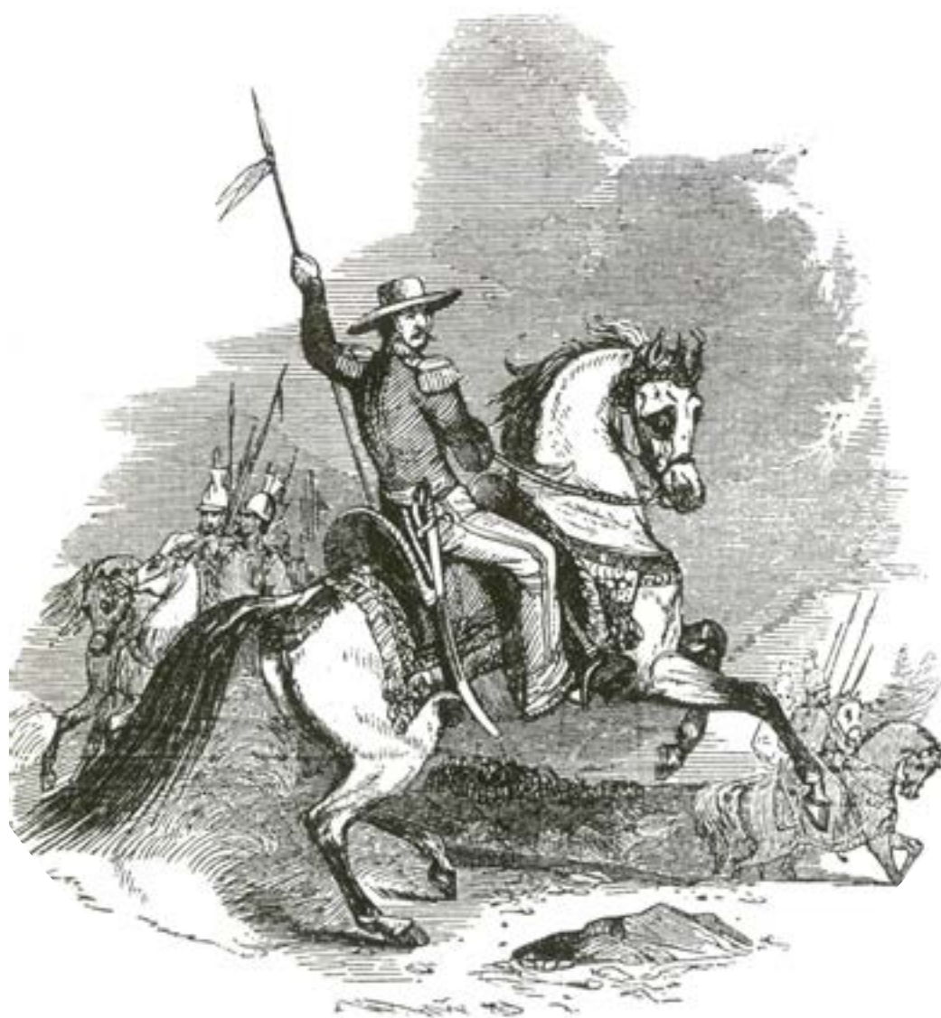
"Mexican lancer", John Frost, Pictorial History of Mexico and the Mexican War , Private Collection.