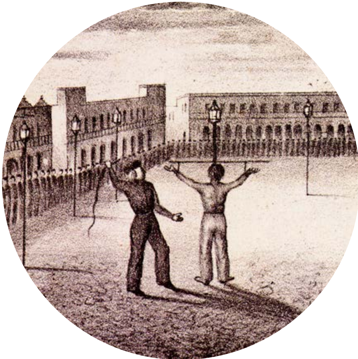
Manuel Murguía, Whippings given by the Americans , xix century. Miniature lithograph. National Museum of Interventions, INAH, Mexico.