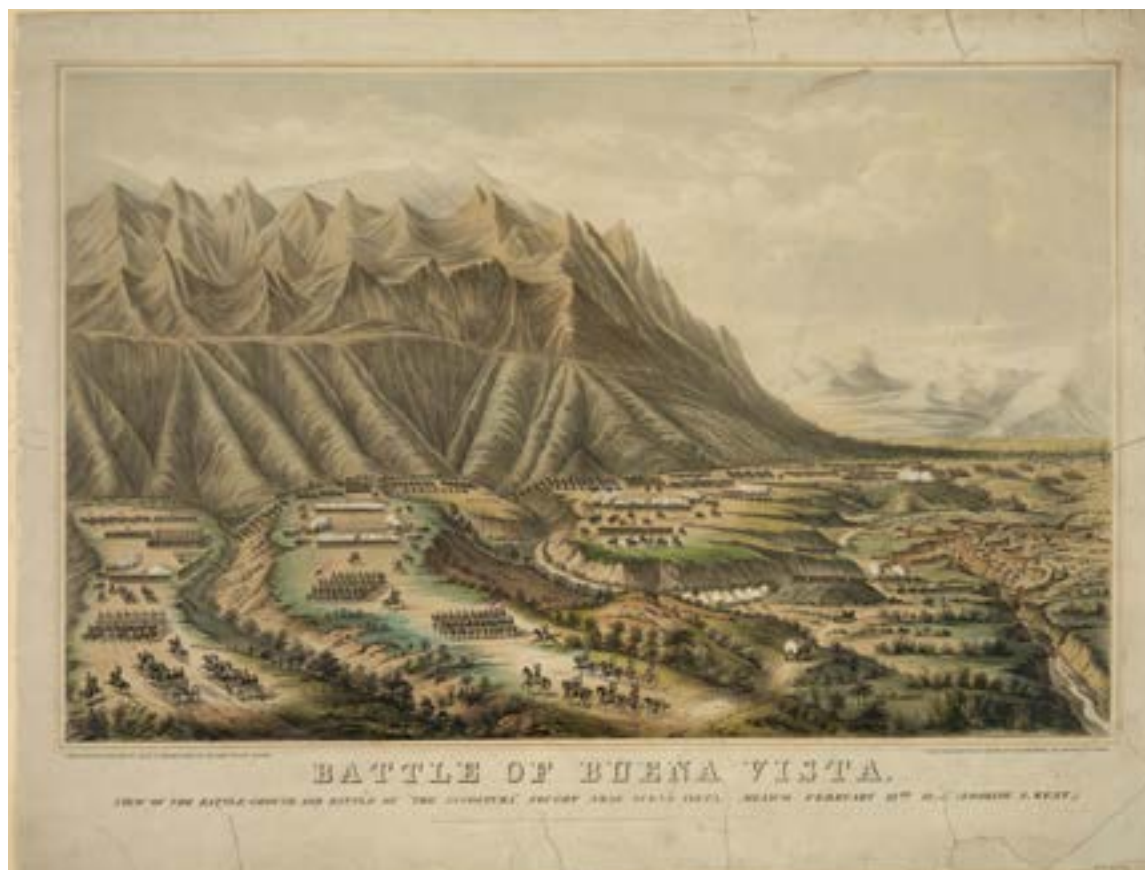
"Battle of Buena Vista. View of the battleground and battle of "The Angostura" fought near Buena Vista, Mexico, February 23rd, 1847 (Looking S. West)", Henry R. Robinson lithograph, 1847. Based on the work by Major Eaton.