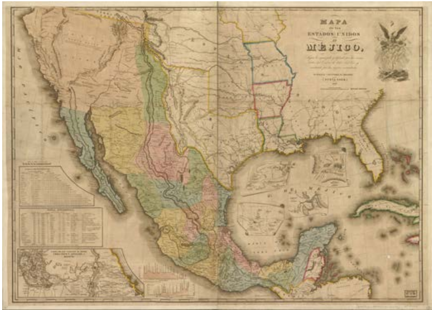
"Map of the United States of Mexico." Map. New York, John Disturnell, 1847. Library of Congress, Washington D.C., USA.