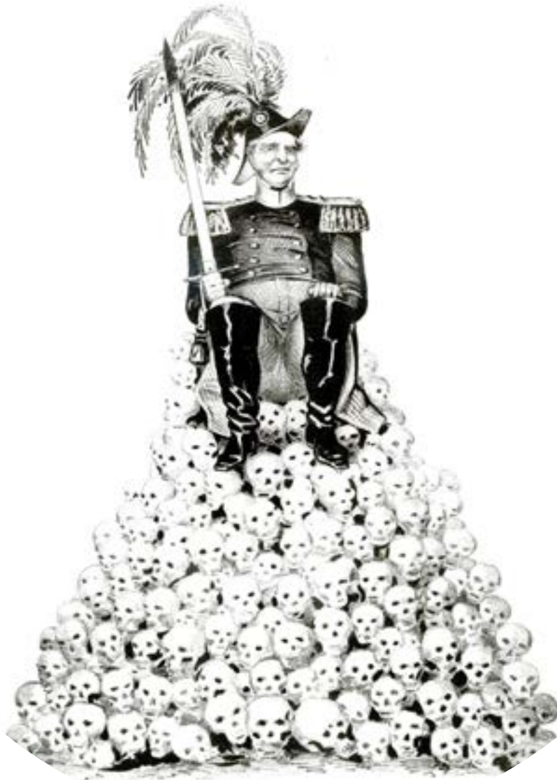
"An available candidate—the one qualification for a Whig president", N. Currier & Ives lithograph, New York, 1848.