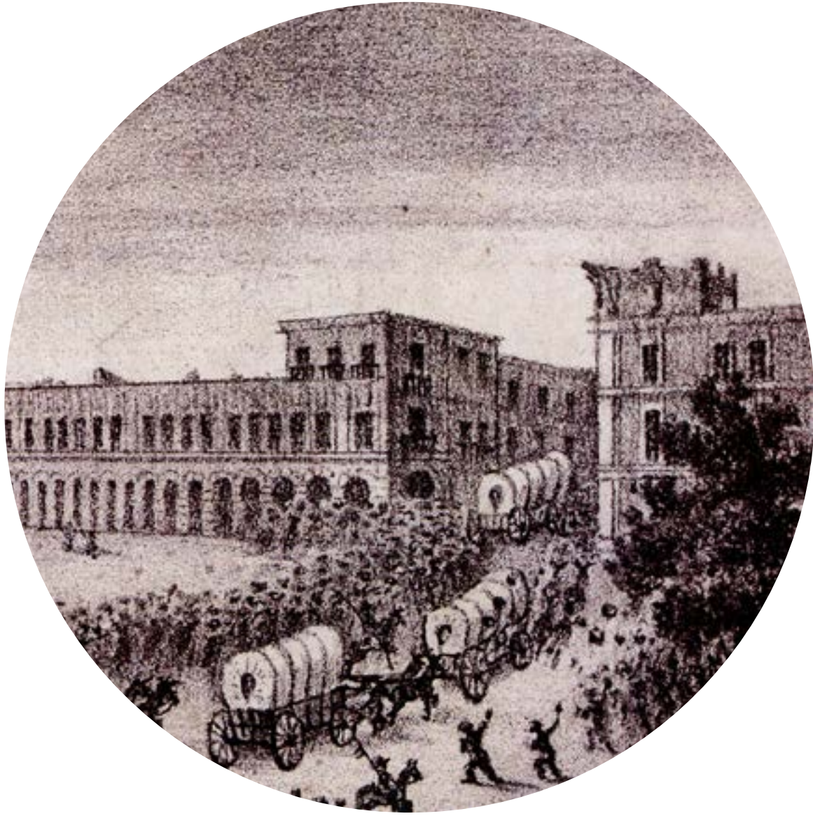
Manuel Murguía, The people stone the cars , XIX century. Miniature lithograph. National Museum of Interventions, INAH, Mexico.