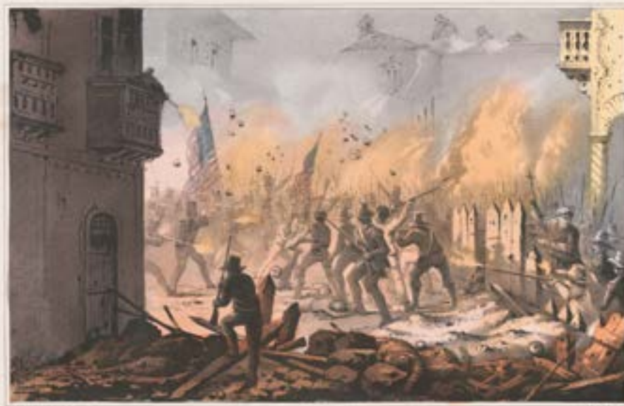
Third Day of the SIEGE OF MONTEREY. Sept. 23 rd 1846.

"Third day of the siege of Monterey [sic]--Sept. 23 rd 1846", N.Y. :lith. & pub. by Sarony & Major, c1846, Library of Congress Prints and Photographs Division Washington, D.C., USA.