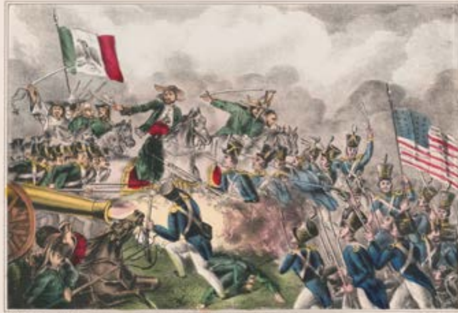
BATTLE OF CERRO GORDO.

"Battle of Cerro Gordo. April 18th 1847", New York, Hartford, Conn., E.B. & E.C. Kellogg 144 Fulton St. N.Y. & 136 Main St. Hartford, Conn., 1847. (Buffalo : D. Needham 223 Main St.) Library of Congress Prints and Photographs Division Washington, D.C., USA.