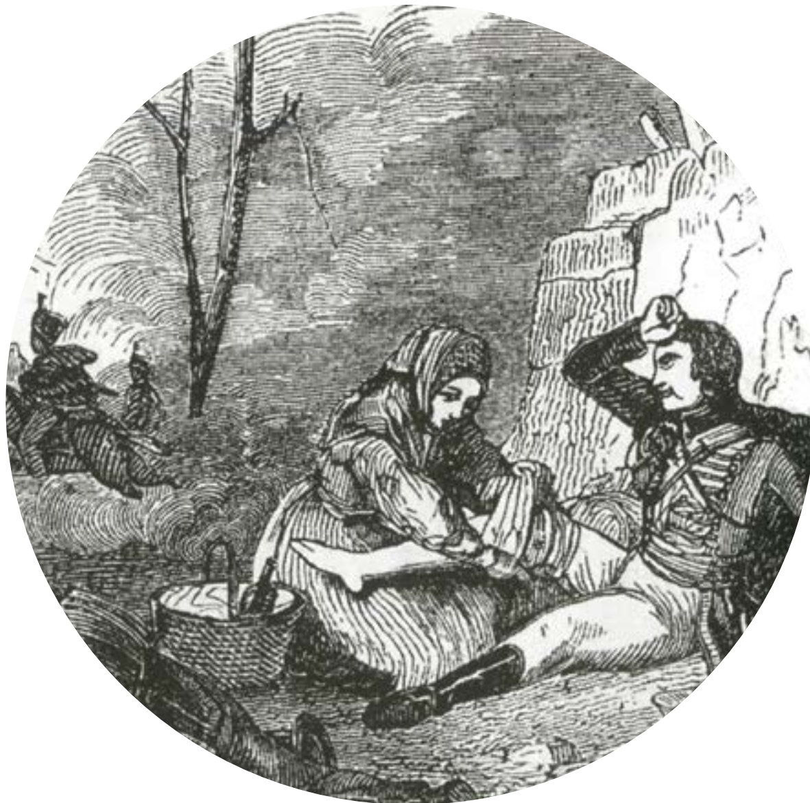
"A Mexican woman helping a wounded soldier", John Frost, Pictorial History of Mexico and the Mexican War , Private Collection.