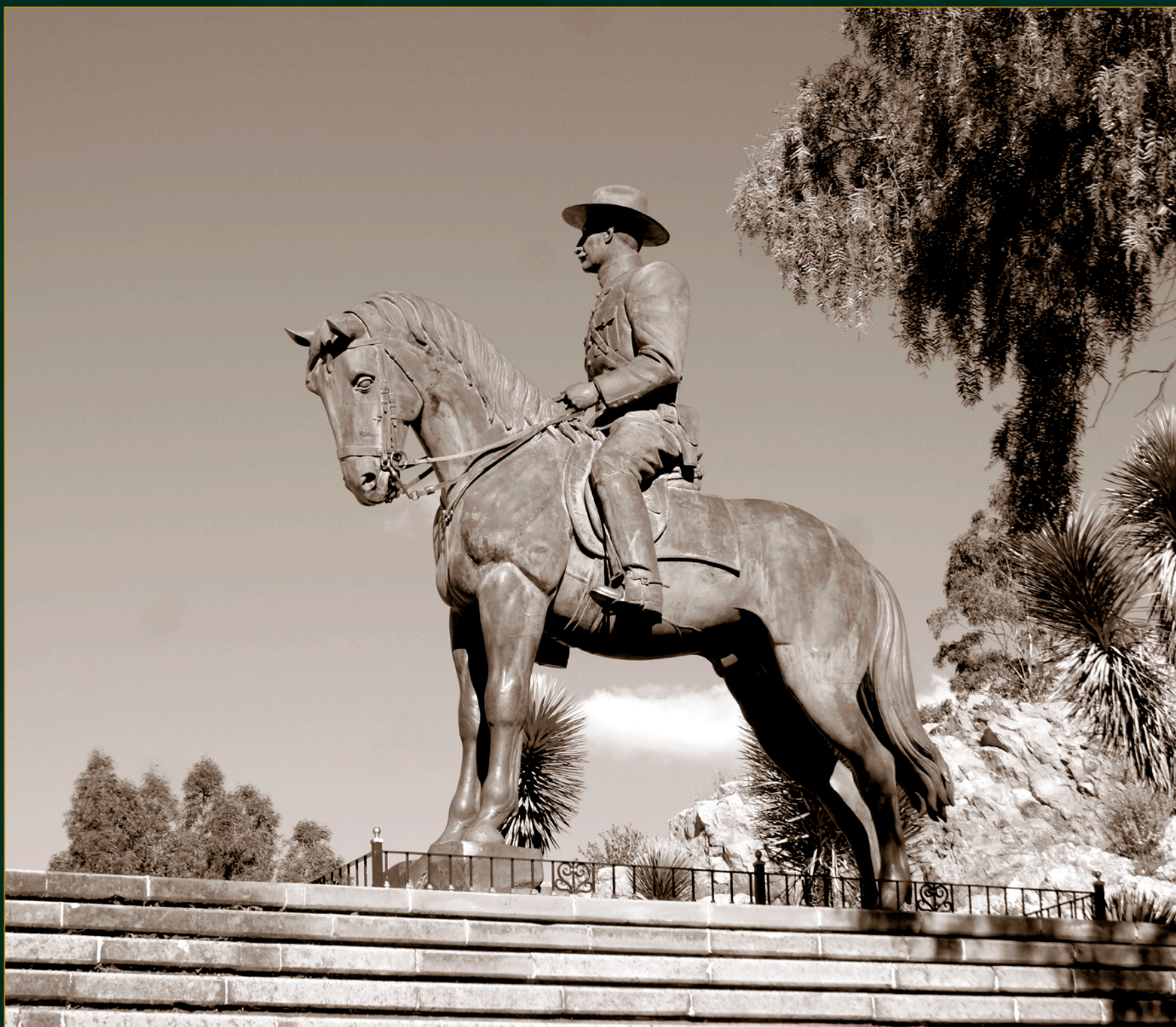
Monumento de Felipe Ángeles en el cerro de La Bufa, Zacatecas, 2016.