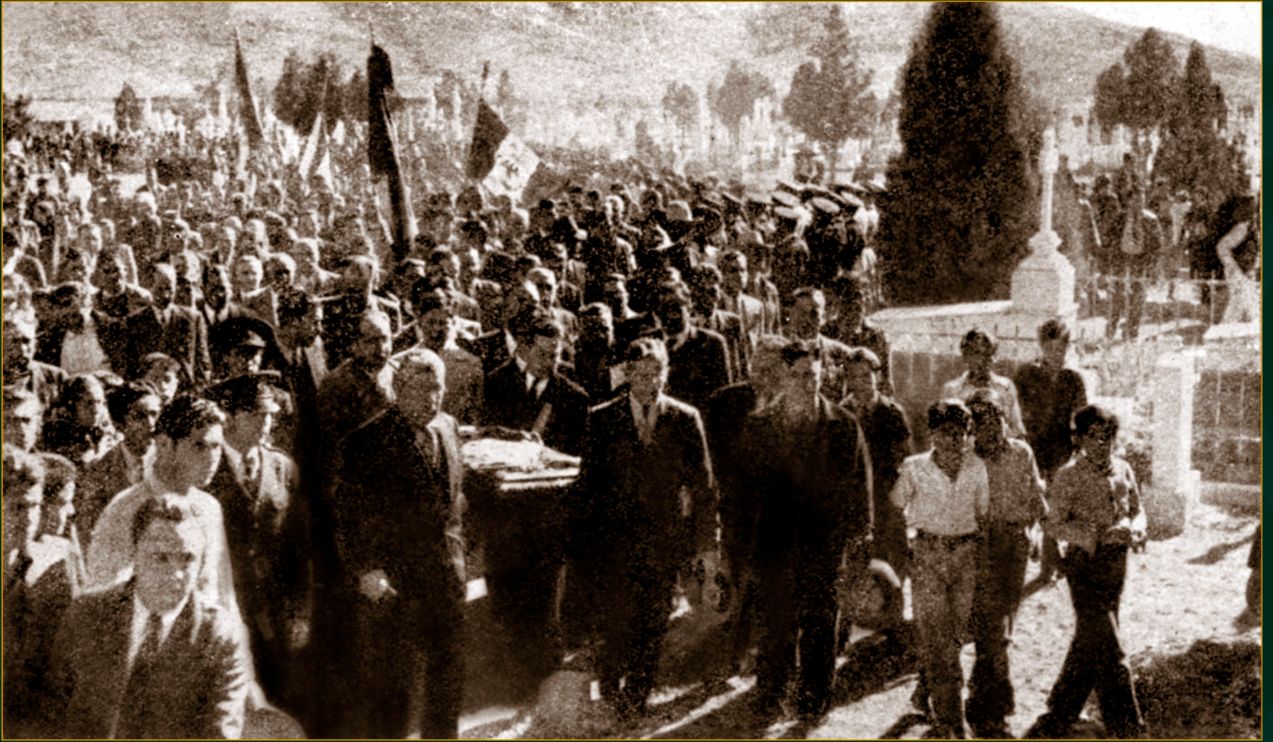
Sacando la urna con los restos del general Felipe Ángeles del panteón municipal de la ciudad de Chihuahua el 22 de noviembre de 1941. Fotomecánico.

“El 22 de noviembre de 1941, al exhumarse los restos del General Ángeles, el vigoroso pueblo de Chihuahua refrendó su hondo sentimiento de simpatía para don Felipe Ángeles. Viejos y mujeres levantaron en alto a sus hijos para contemplar los despojos sagrados y arrojar un laurel y una flor al paso de un Benemérito de la Revolución”.