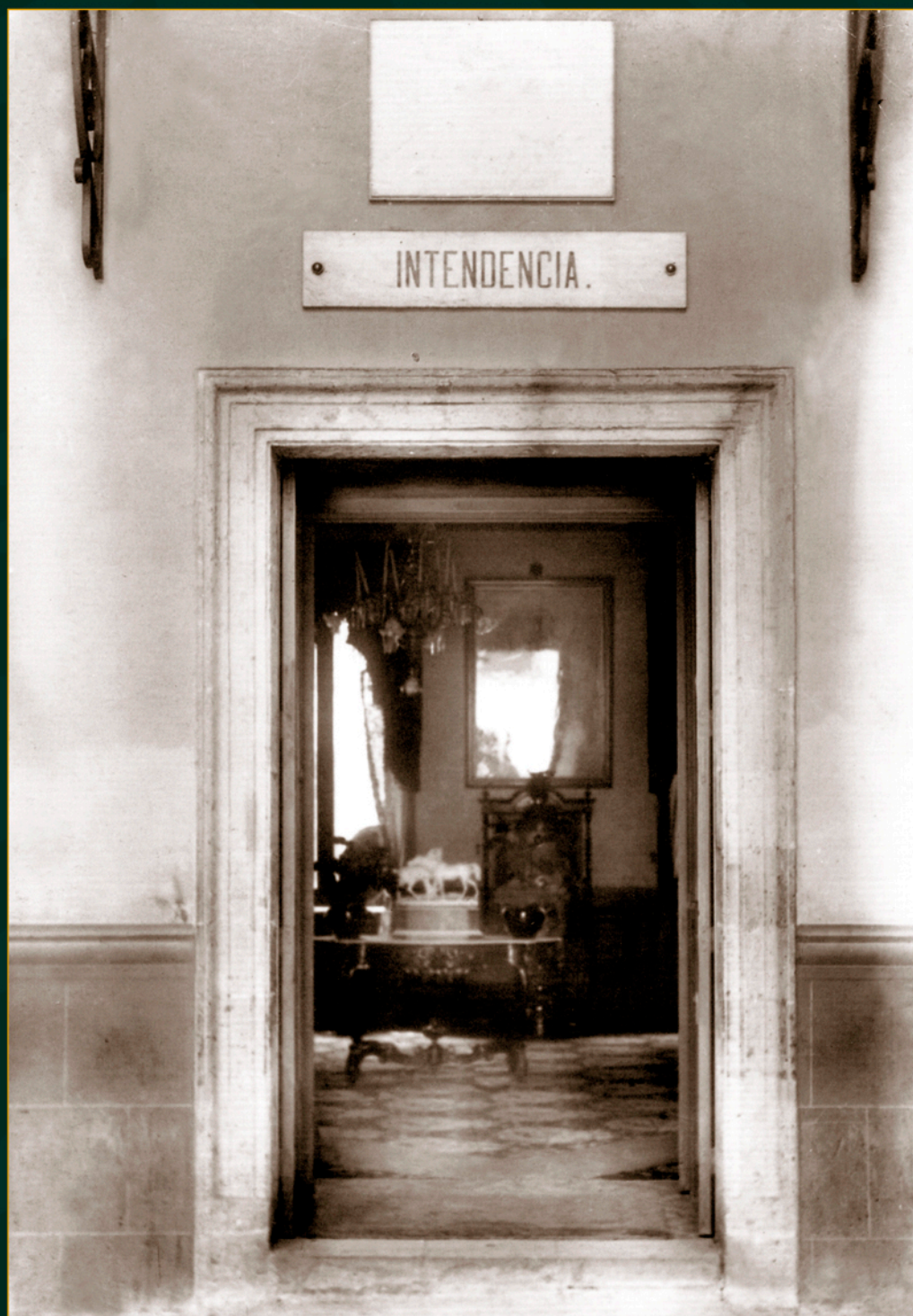
En la Intendencia de Palacio Nacional estuvieron presos Francisco I. Madero, José María Pino Suárez y Felipe Ángeles del 19 al 22 de febrero de 1913.

La mañana del 18 de febrero de 1913, el general Ángeles fue arrestado en un cuarto de la Intendencia de Palacio Nacional, junto con el presidente Madero y el vicepresidente José María Pino Suárez.