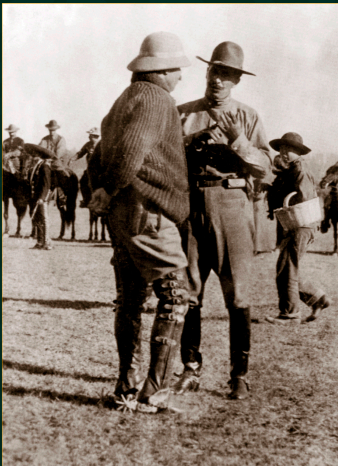
Francisco Villa y el general Felipe Ángeles, ca. 1914.

Fotomecánico. Acervo INEHRM. SECRETARÍA DE CULTURA. INEHRM.FOTOTECA.MX.