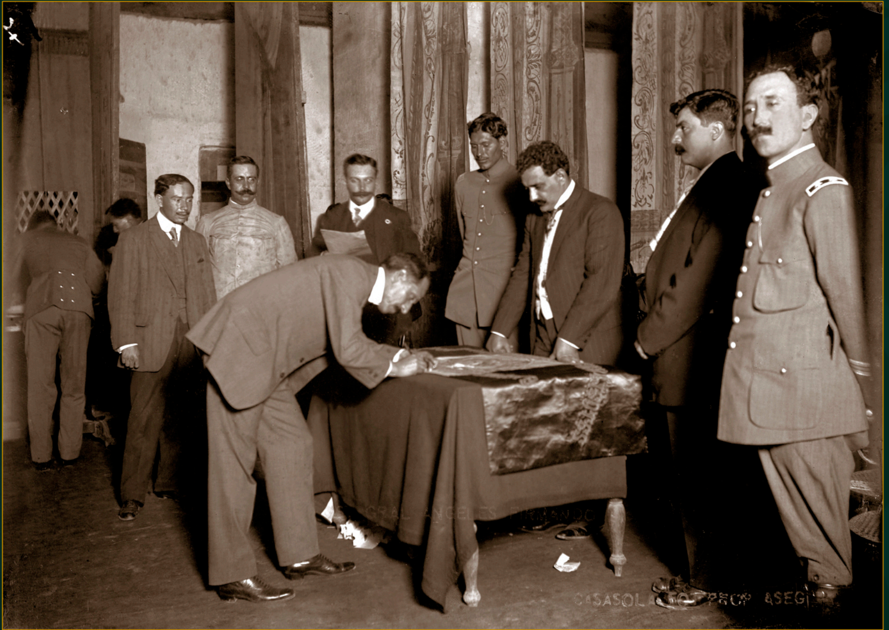
El general Felipe Ángeles firma la bandera de la Convención de Aguascalientes, octubre de 1914.