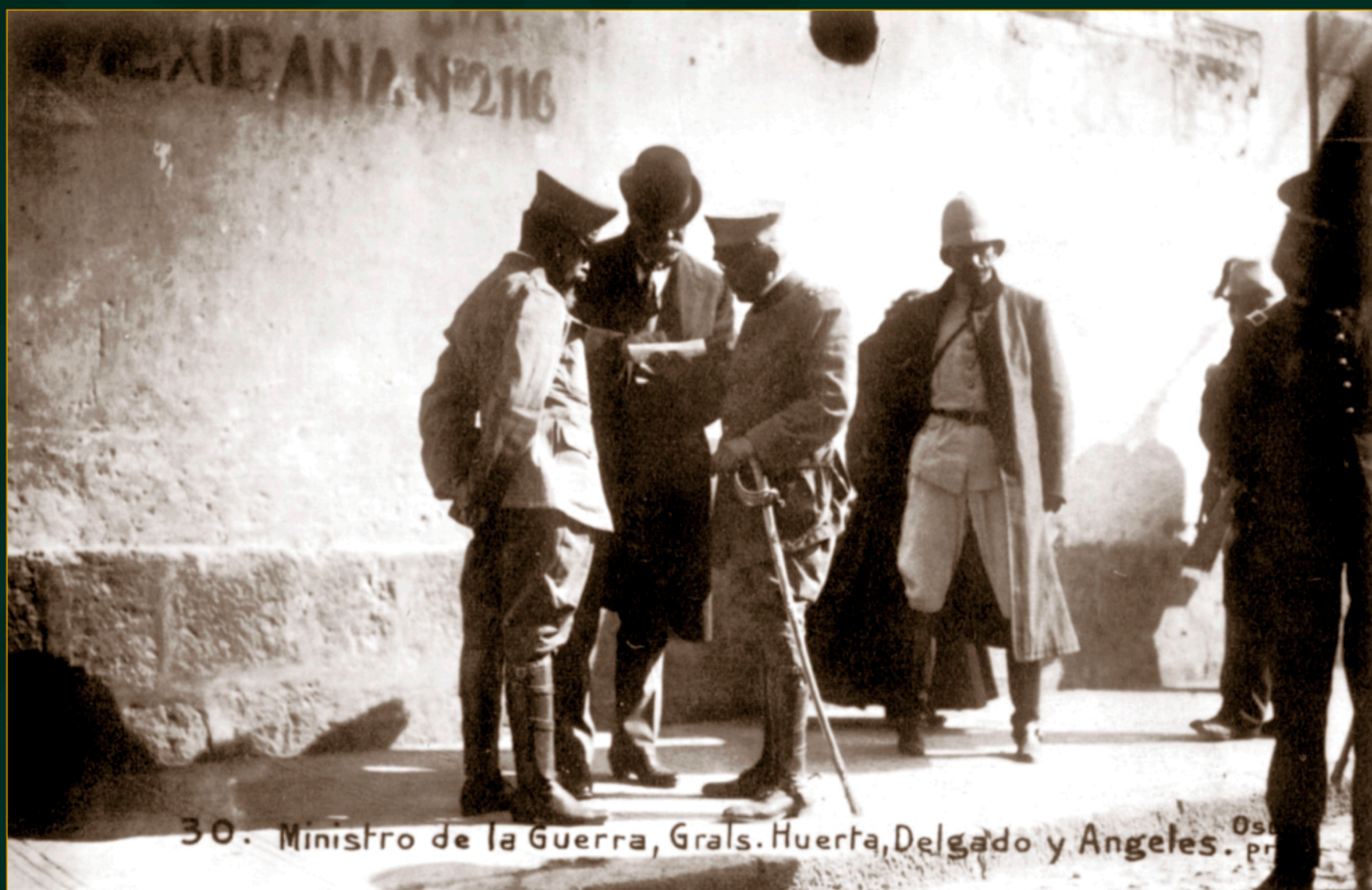
Generales Huerta, Delgado y Ángeles, 16 de febrero de 1913.

El 9 de febrero de 1913 se levantaron en armas los generales Manuel Mondragón, Bernardo Reyes y Félix Díaz. El presidente Madero viajó a Cuernavaca para encontrarse con Ángeles y confiarle el mando de las tropas leales. Sin embargo, Ángeles quedó bajo las órdenes de Victoriano Huerta. Pronto fue evidente que los ataques contra los levantados nunca tuvieron la voluntad real de aplastarlos.