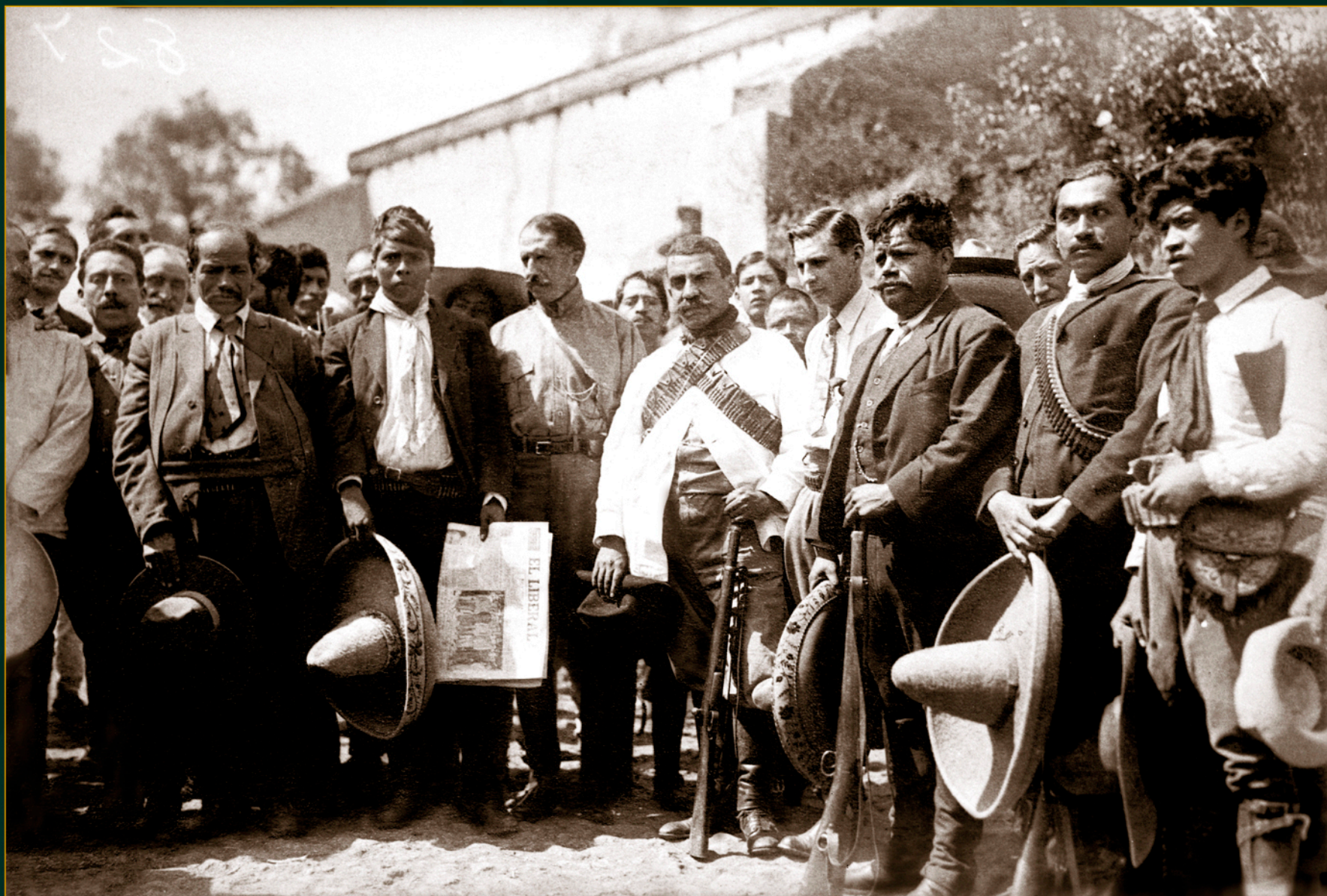
Felipe Ángeles reunido con zapatistas. Retrato de grupo, octubre de 1914.