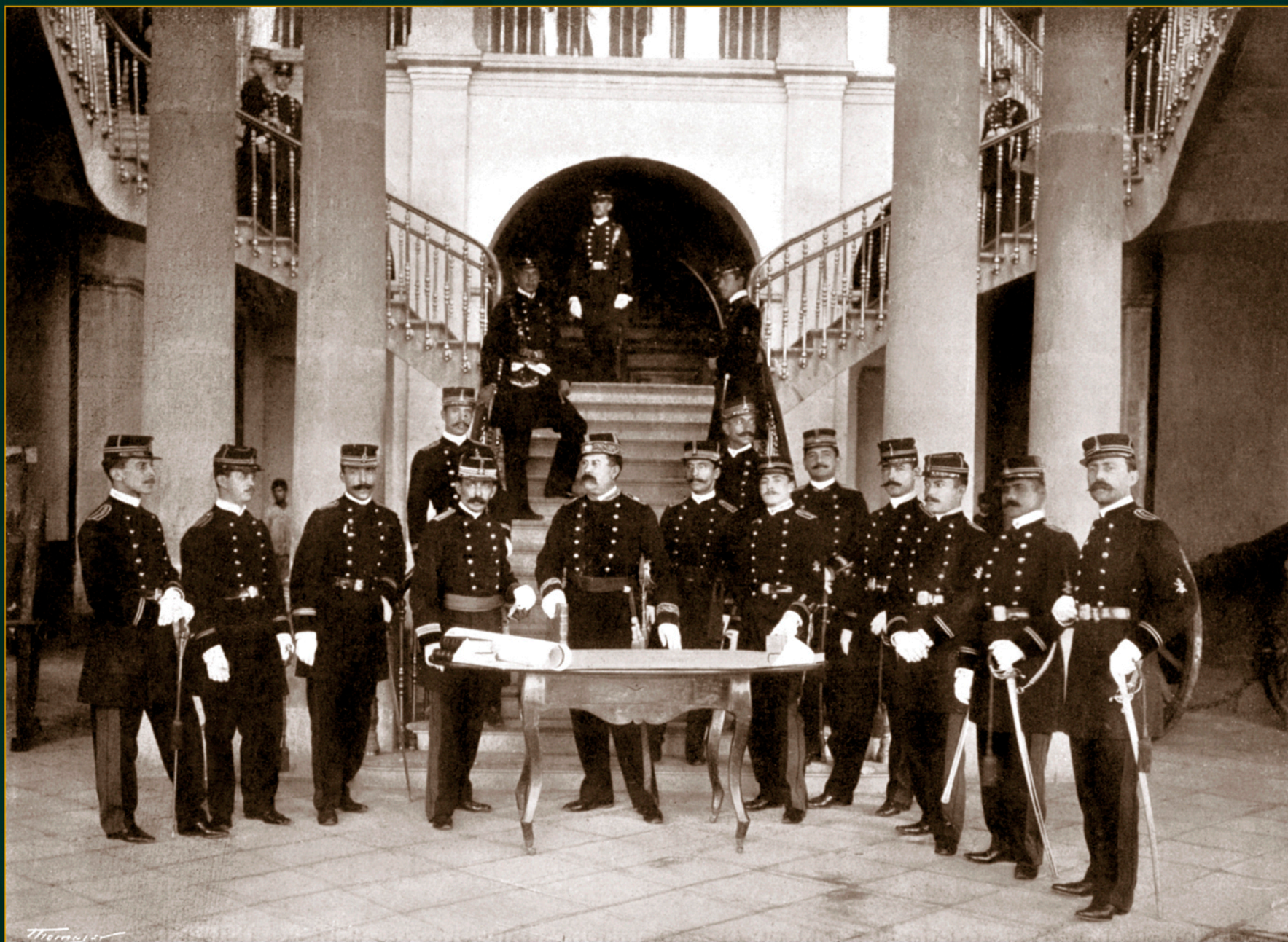
Personal militar del Colegio Militar, ca. 1900.

Fotomecánico.