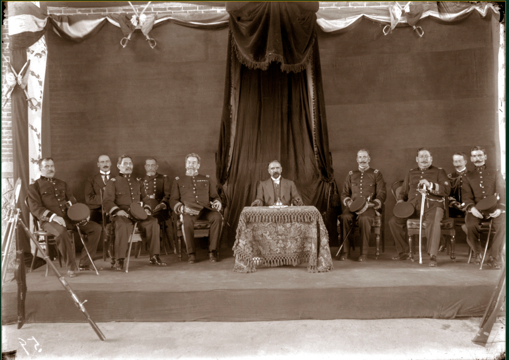
El presidente Francisco I. Madero en una ceremonia en el H. Colegio Militar, a su izquierda el director del Colegio, general Felipe Ángeles, 1912.