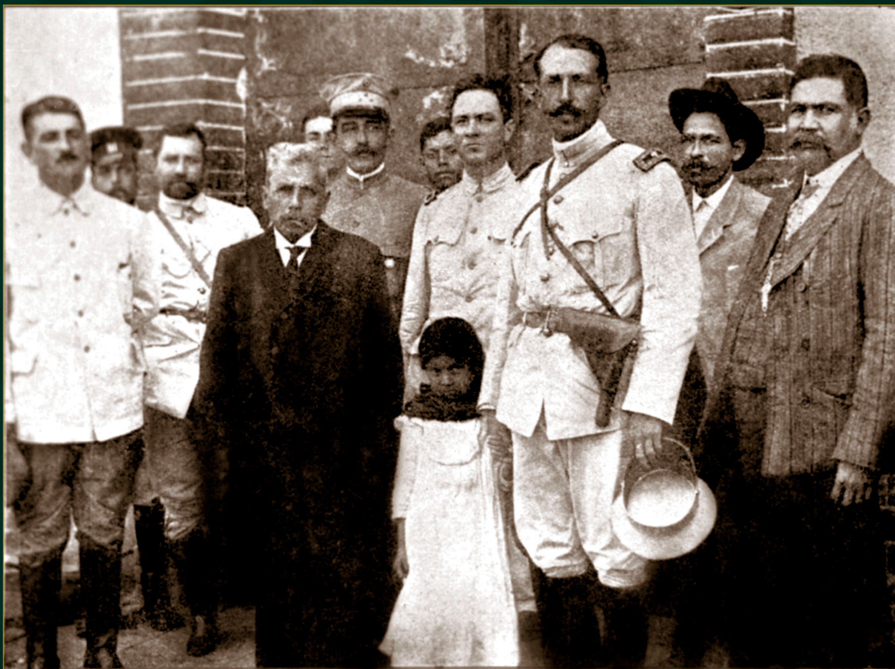
El gobernador de Morelos, licenciado Aniceto Villamar, en Yautepec, acompañado de los generales Felipe Ángeles y Fortino Dávila, 1912.