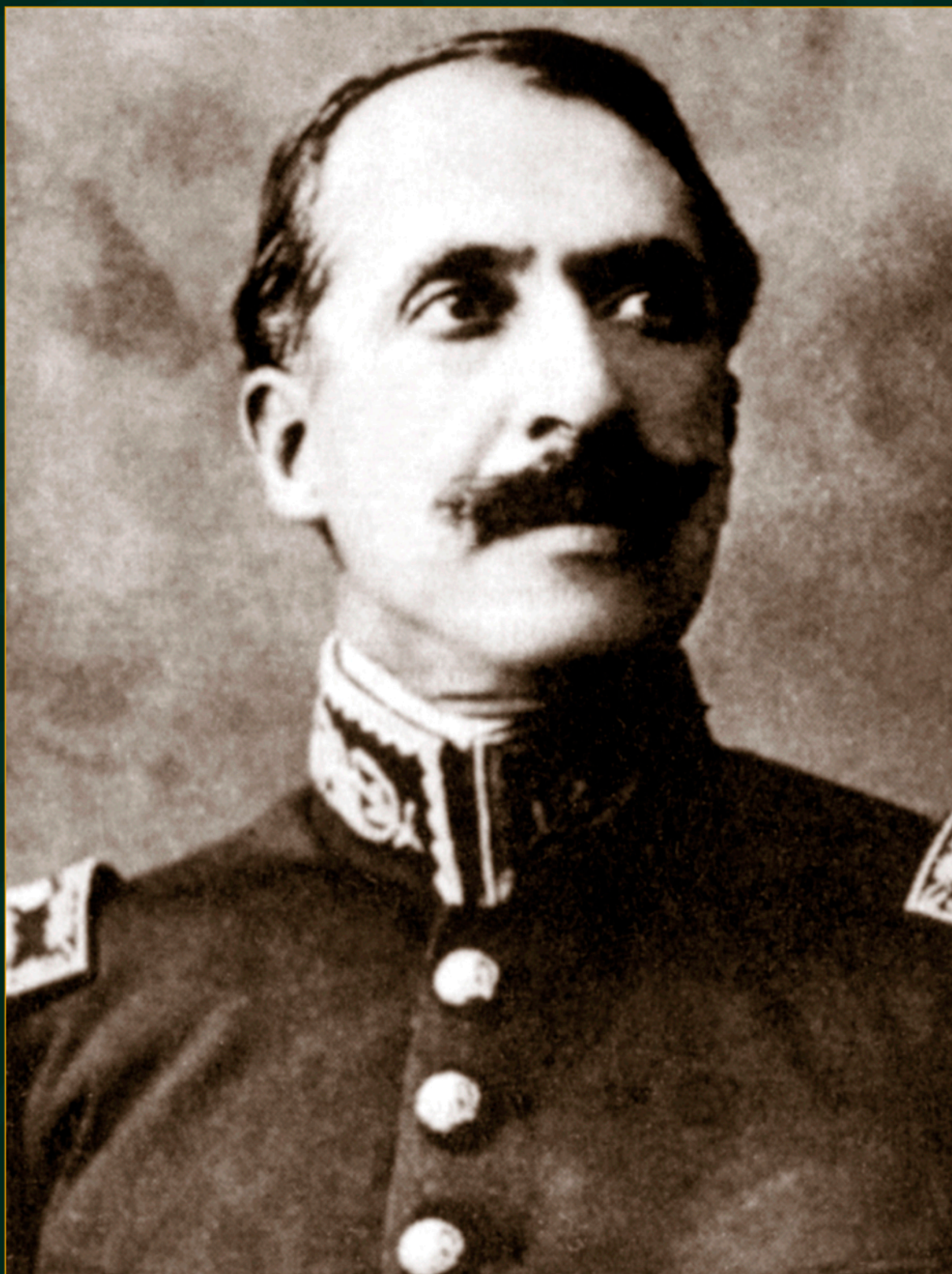
Coronel Felipe Ángeles.

Fotomecánico. Acervo INEHRM. SECRETARÍA DE CULTURA.INEHRM.FOTOTECA.MX.