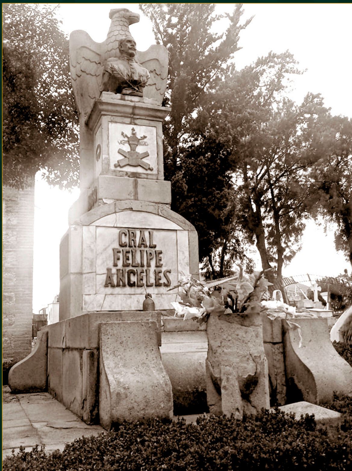
Tumba del general Felipe Ángeles en el panteón de Pachuca, Hidalgo, 2019.

“Hijo de un coronel republicano que peleó contra la Intervención y el Imperio, el General Ángeles tuvo por norma y por lema de su vida el cumplimiento estricto del deber [...]; fue un hombre cuyas facultades anímicas estaban perfectamente equilibradas en su inteligencia, en su voluntad de acero y en su corazón de oro”.