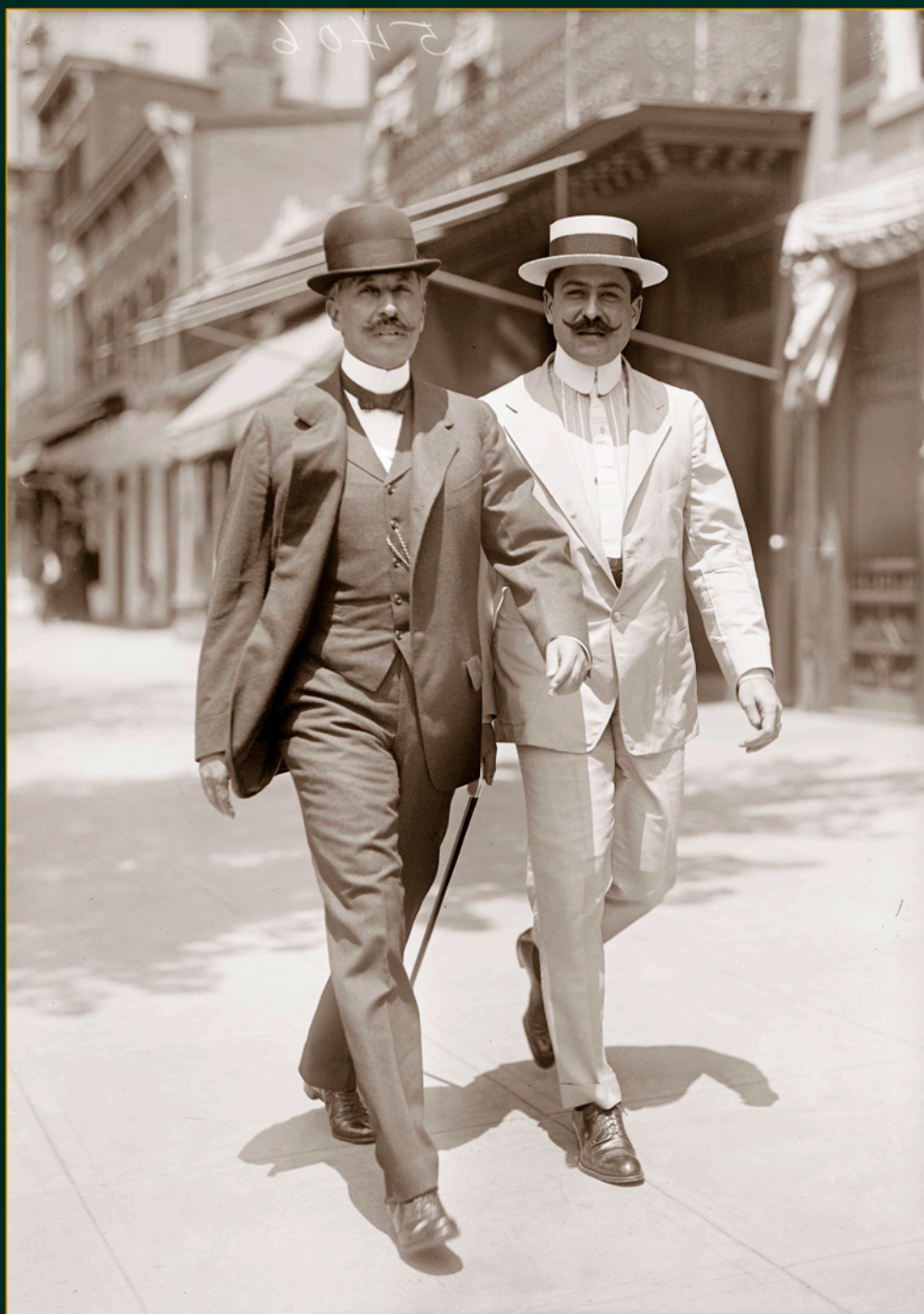
El general Felipe Ángeles en el exilio, 1917. Biblioteca del Congreso de Estados Unidos.

Tras el desastre militar en la División del Norte en el Bajío, el general Ángeles se trasladó a Estados Unidos, donde inició una etapa de madurez intelectual. Durante su destierro, junto con algunos intelectuales revolucionarios formó la Alianza Liberal Mexicana. En la ciudad de Nueva York se acercó a textos marxistas y leninistas, descubriendo su afinidad con las ideas socialistas.