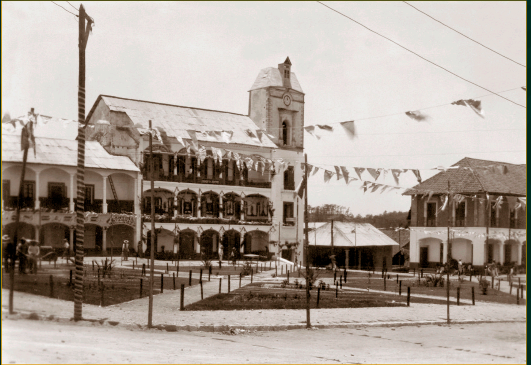
Plaza de Zacualtipán, Hidalgo.

El 13 de junio de 1868 nació Felipe de Jesús Ángeles Ramírez en Zacualtipán, un pueblo enclavado en la sierra del estado de Hidalgo. Su padre fue el coronel Felipe Ángeles, militar republicano que luchó contra la Intervención Francesa y que se desempeñó como jefe político de varias poblaciones hidalguenses.