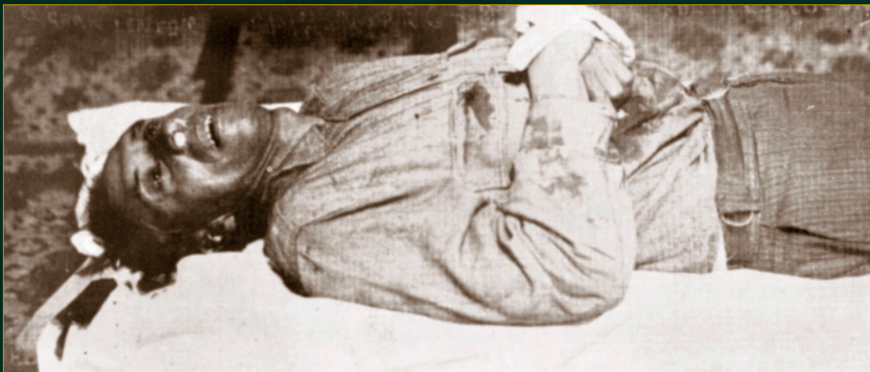
El cadáver del general Felipe Ángeles, 26 de noviembre de 1919. Fotomecánico.