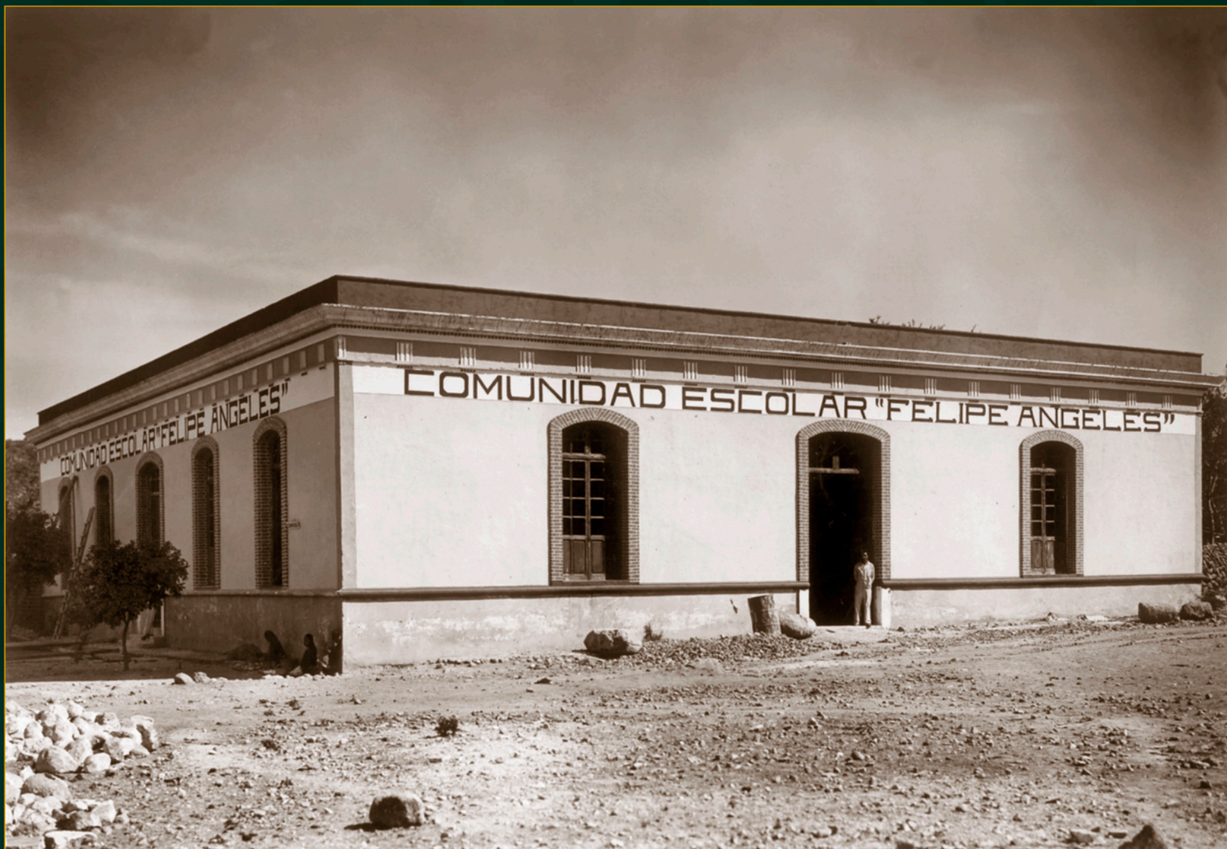
Comunidad Escolar "Felipe Ángeles", Coatetelco, Morelos, ca. 1950.