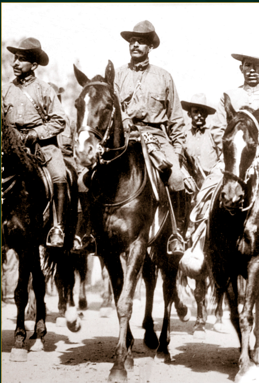
Felipe Ángeles y otros militares a caballo, 6 de diciembre de 1914.