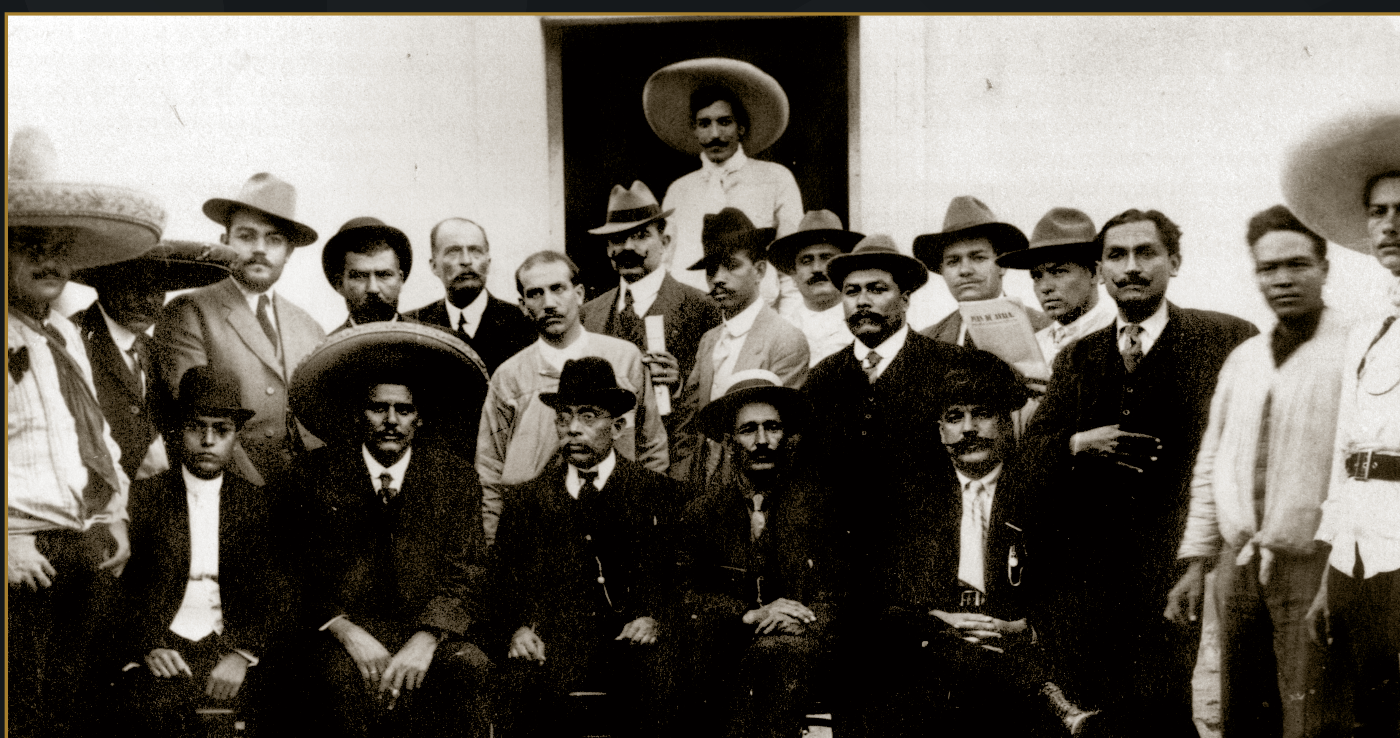
Delegados zapatistas en la Soberana Convención Revolucionaria, 1914.