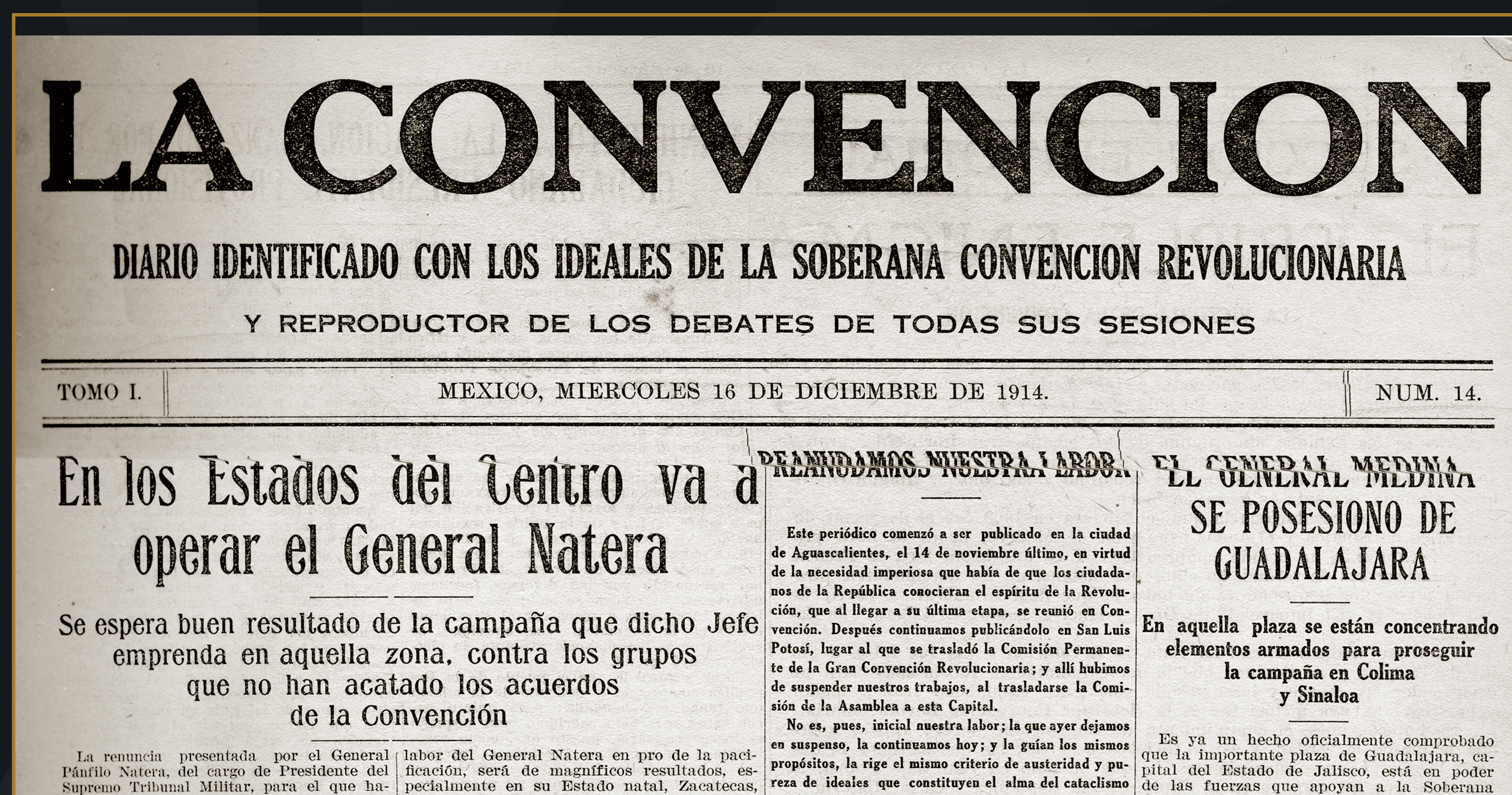
La Convención, T. 1, Núm. 14, 16 de diciembre, 1914.