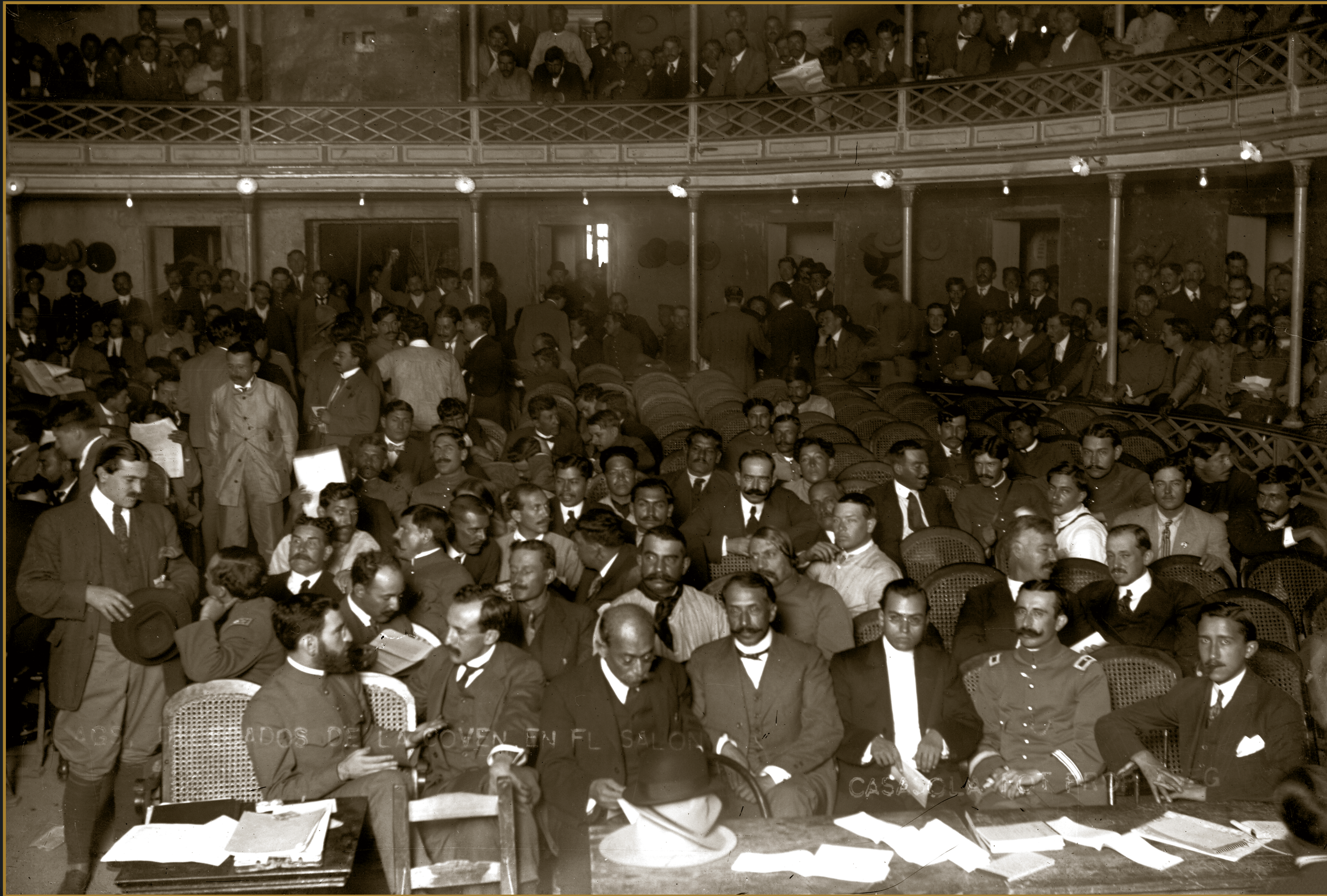
Aspecto de la Soberana Convención Revolucionaria, 1914.

Francisco Villa a la Convención, 5 de noviembre de 1914.