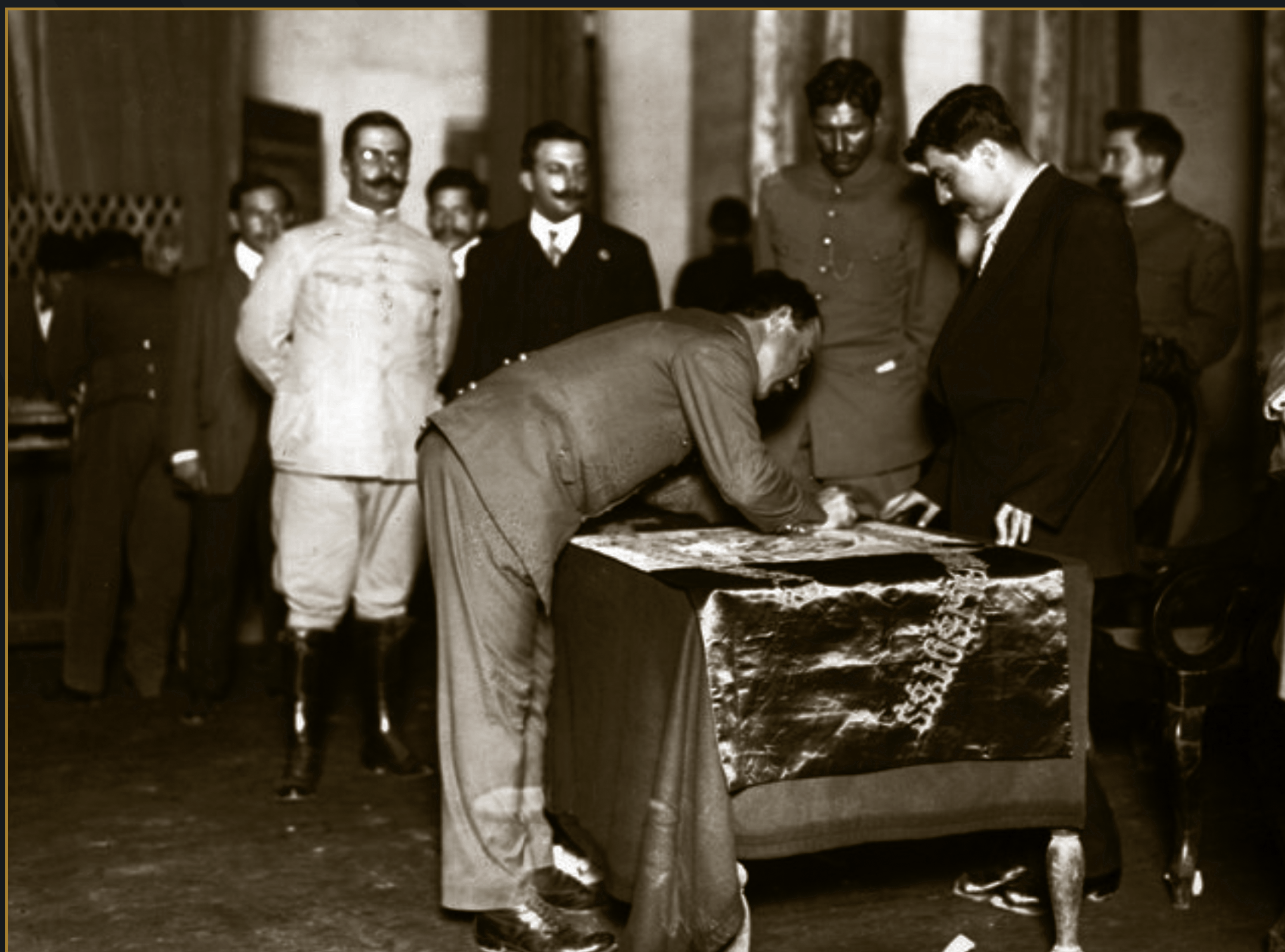
Álvaro Obregón firma la bandera de la Soberana Convención Revolucionaria, 1914.

Preámbulo del "Proyecto de Programa de Reformas Políticas y Sociales de la Revolución", 3 de marzo de 1915.