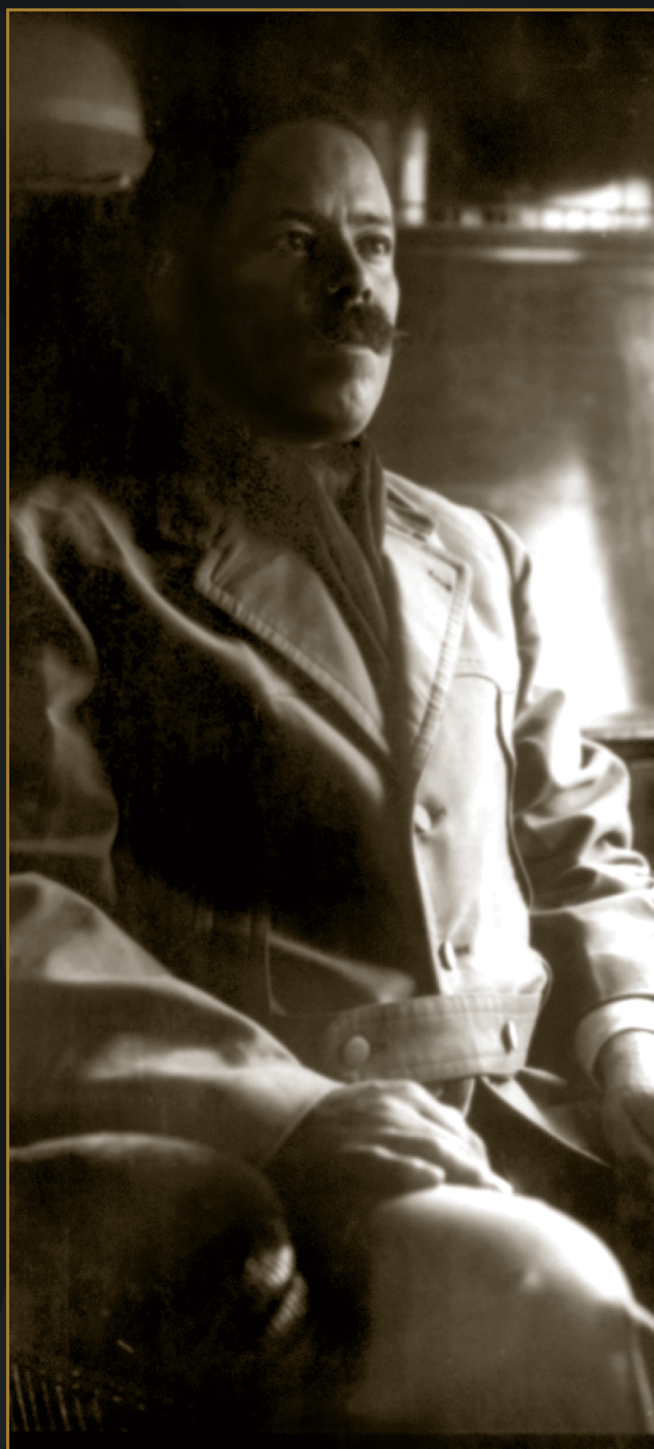
General Francisco Villa sentado en un vagón del ferrocarril, 1914.

Respuesta de los generales de la División del Norte a Venustiano Carranza, 10 de junio de 1914.