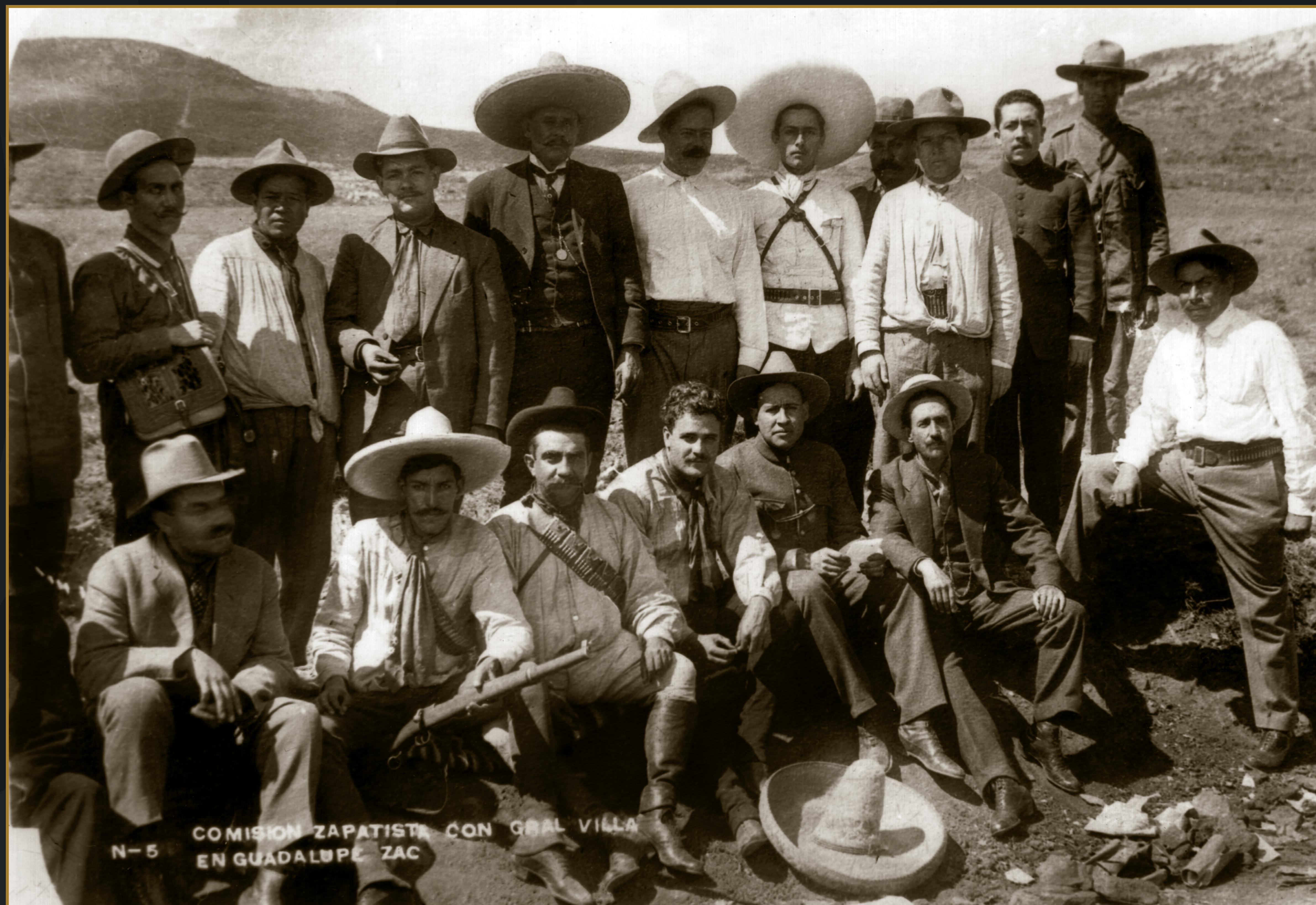
Comisión zapatista con el general Villa, en Guadalupe, Zacatecas, 1914.