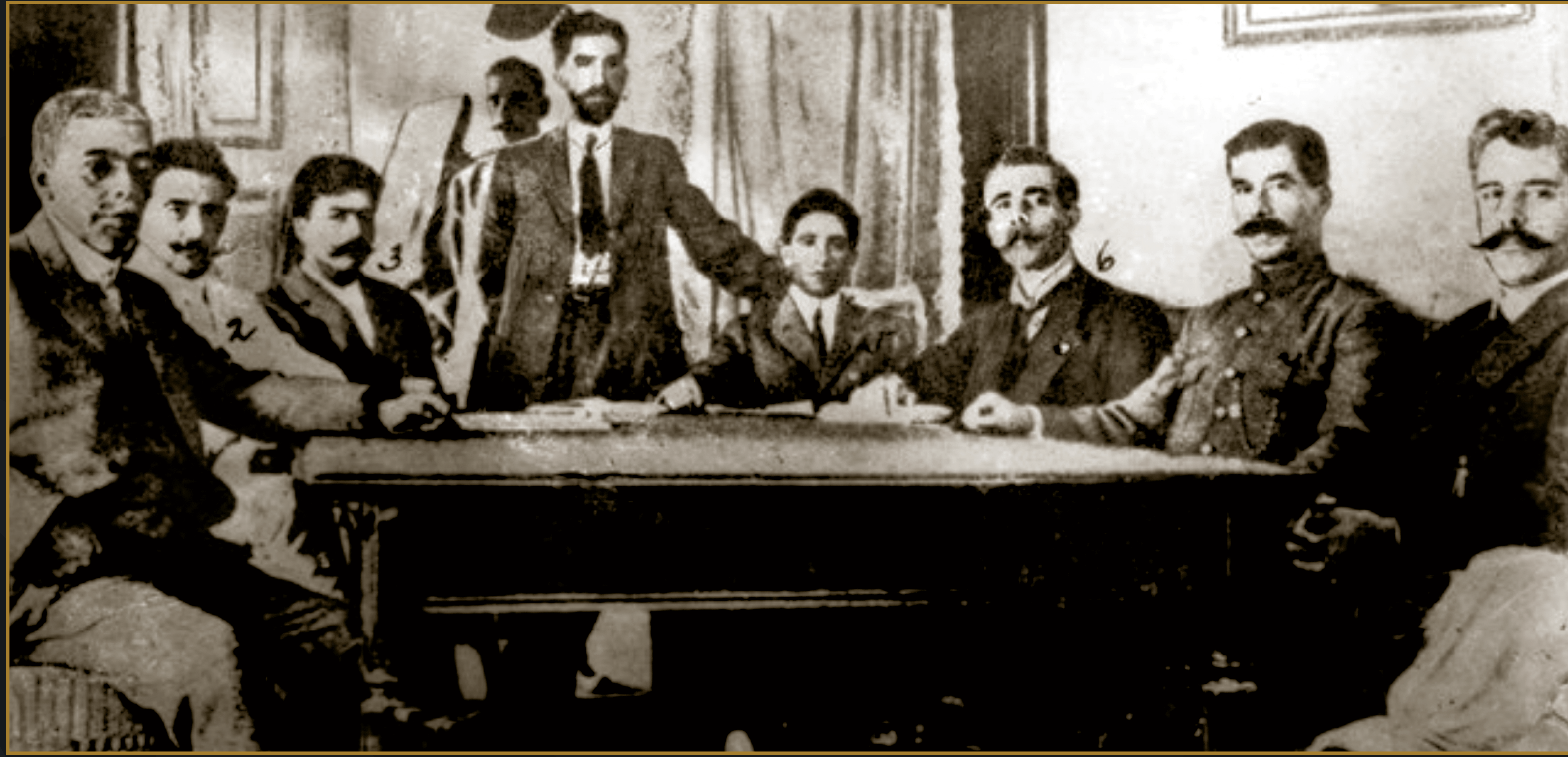
Casasola, Conferencia en Torreón entre los jefes representantes de la División del Norte y el Ejército del Noreste, 1914. © (641476) SECRETARÍA DE CULTURA.INAH.SINAFO.FN.MX.