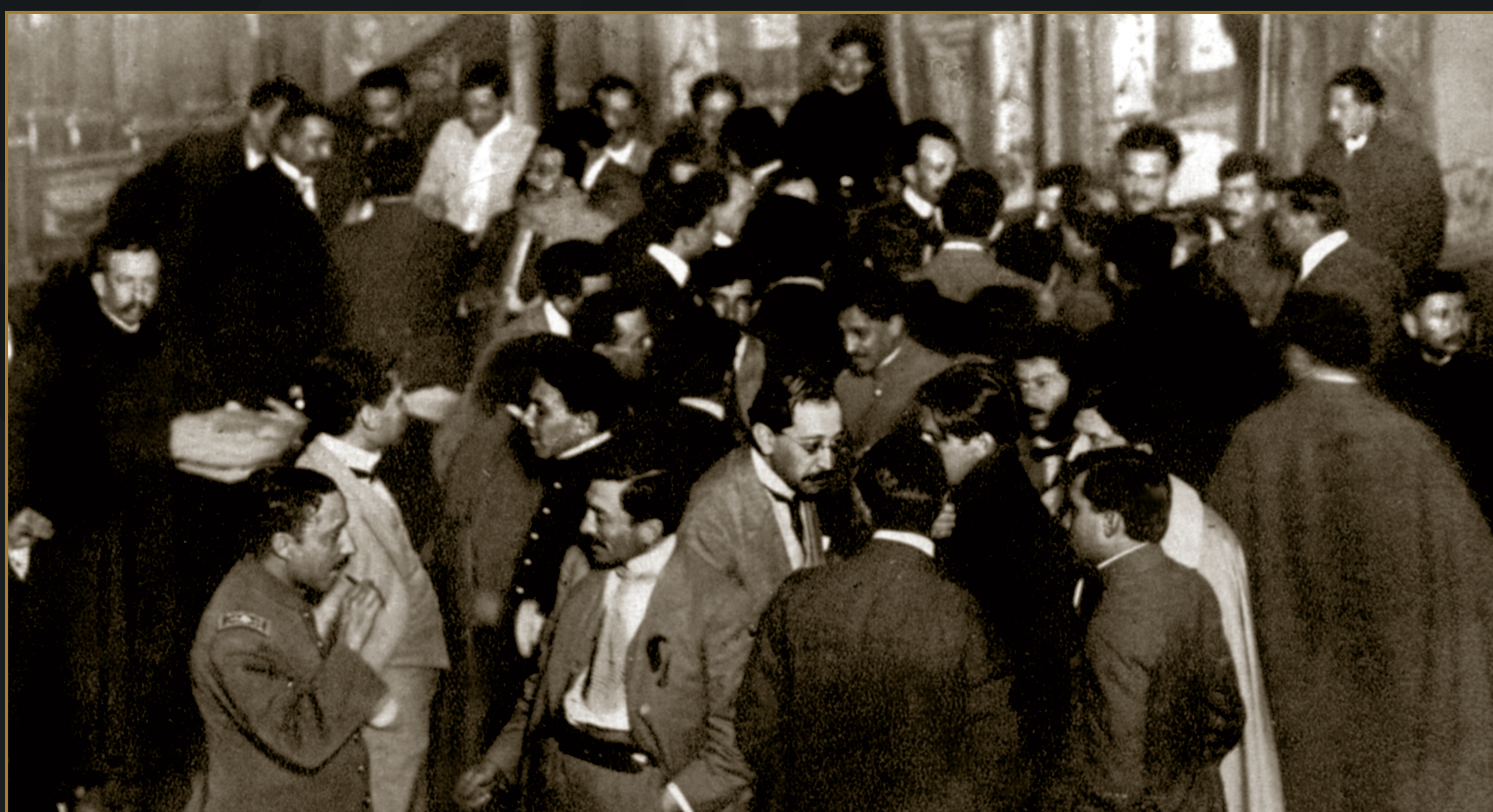
Casasola, Delegados convencionistas votan para elegir presidente provisional, 1914.

Respuesta de Venustiano Carranza a la Convención, 29 de octubre de 1914.